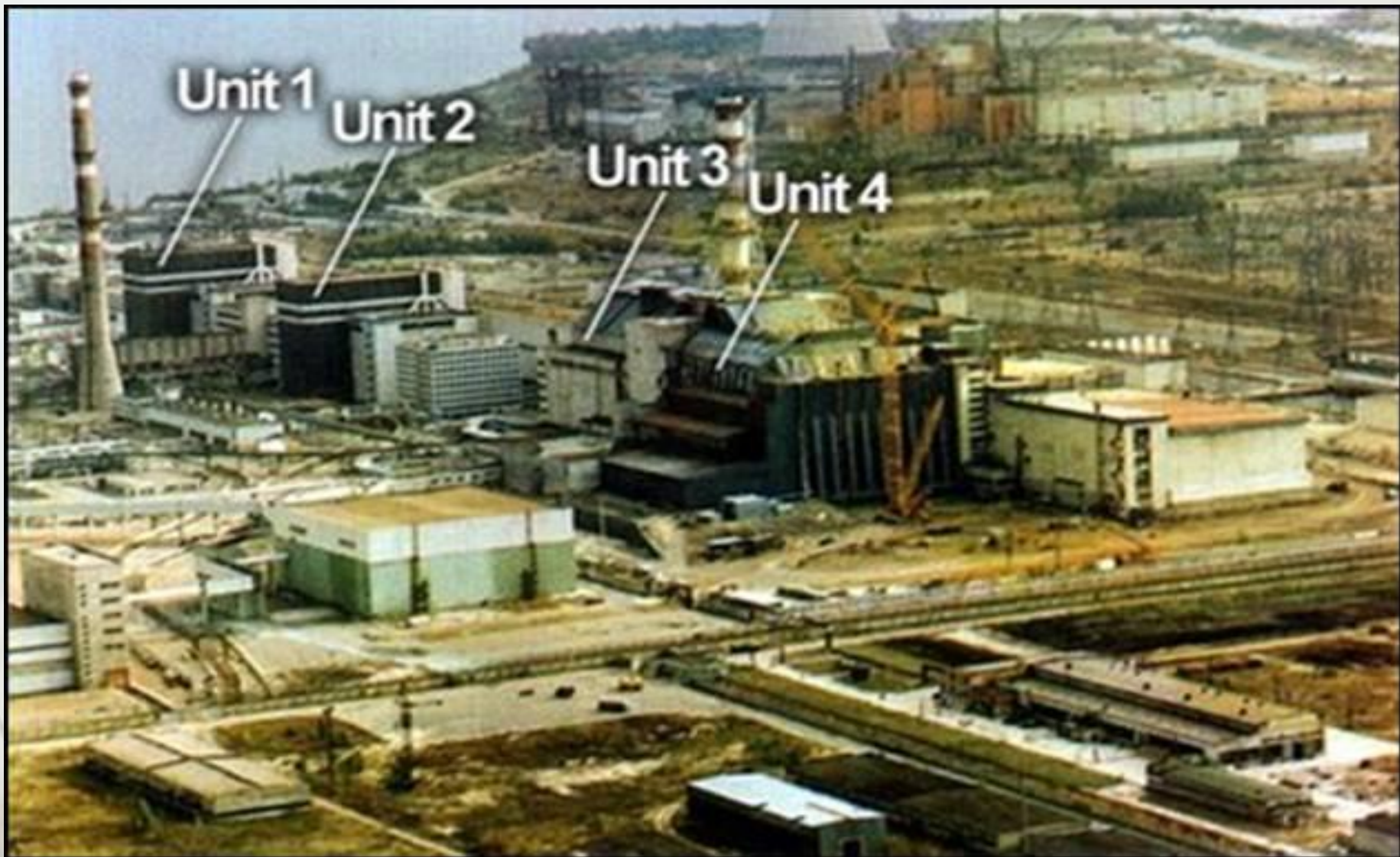
Место расположения 4-го энергоблока Чернобыльской АЭС.