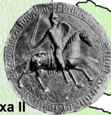
печать Генриха II