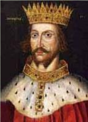
Король Генрих II (1154 – 1189 гг.)

1. Поработайте с текстом, с.156 (с 3- го абзаца) – 157