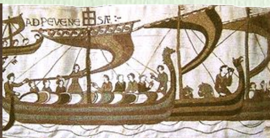
Корабли Вильгельма переправляются через Ла-Манш