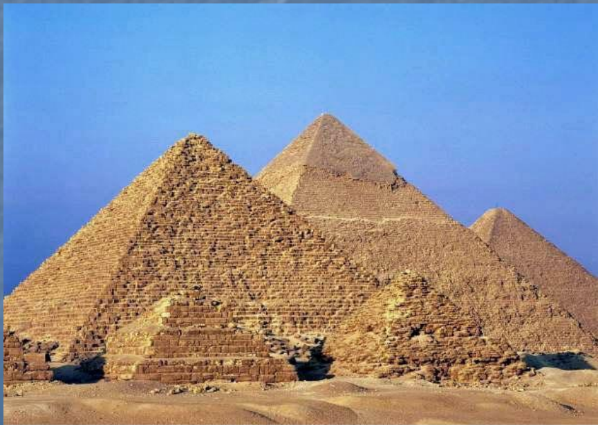
Гиза. Долина Пирамид