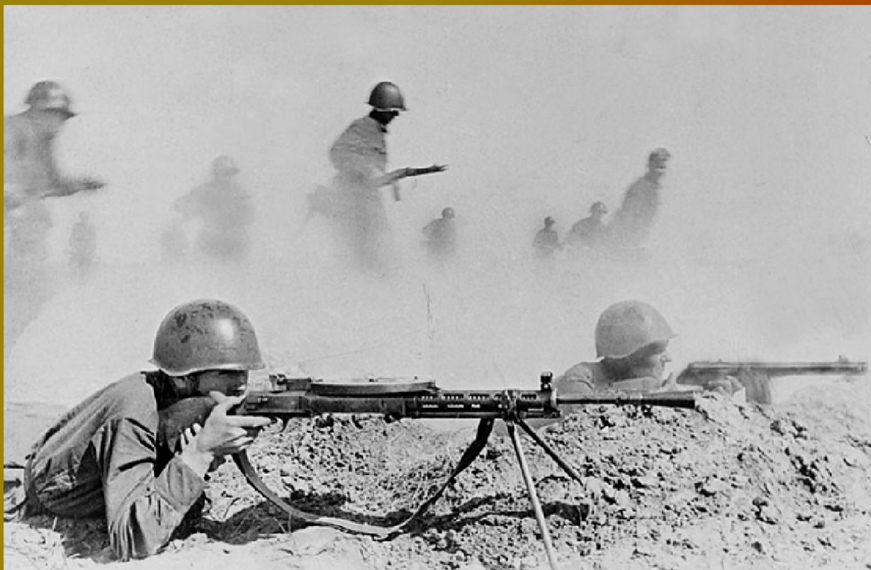
Бой на Сталинградском направлении. Лето 1942 года.