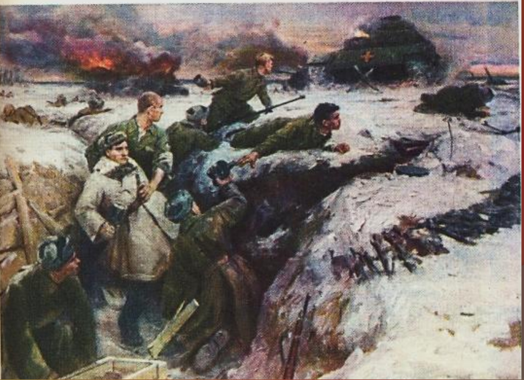
Подвиг гвардейцев-панфиловцев. С картины В. Панфилова.