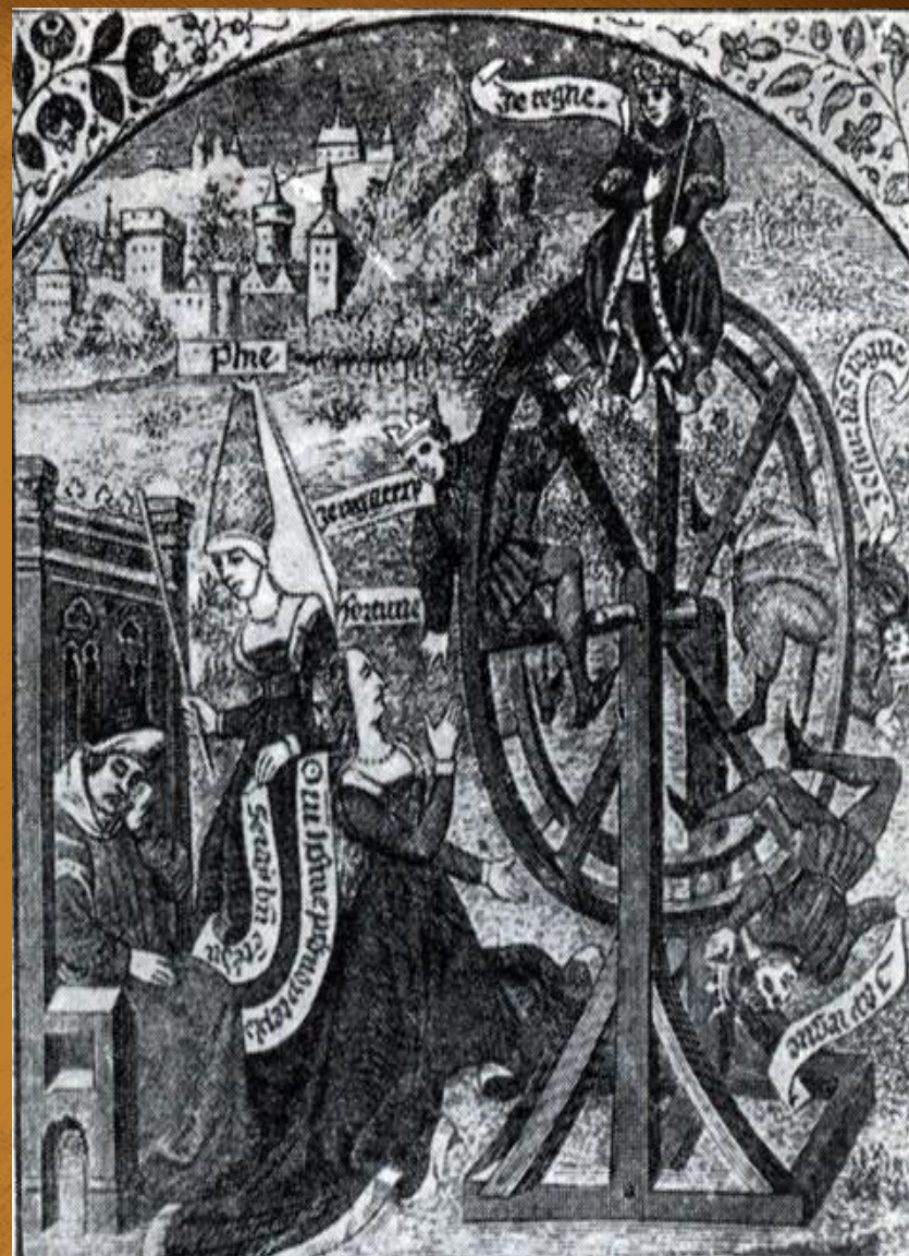
Колесо Фортуны – типичный эпизод моралите.