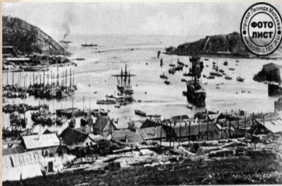
Вход в Порт-Артур. Entrée à Port-Arthur. №4.

В 1898 г. Россия получила в аренду у Китая часть Ляодунского полуострова с Порт-Артуром и Далянем (Дальним) .