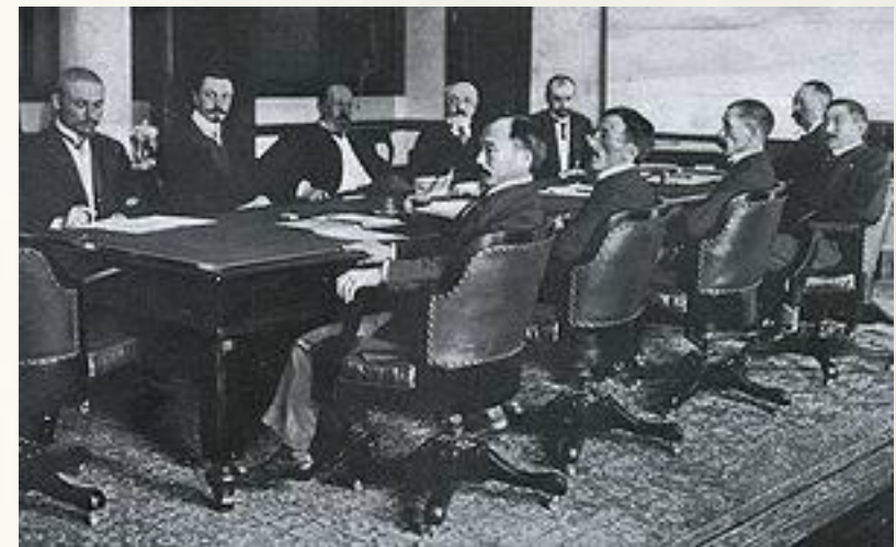
Слева направо: с русской стороны (дальняя часть стола) — Г. А. Плансон, К. Д. Набоков, С. Ю. Витте, Р. Р. Розен, И. Я. Коростовец; с японской стороны (ближняя часть стола) — Адати (нем.), Отиай, Комура (англ.), Такахира (англ.), Сато