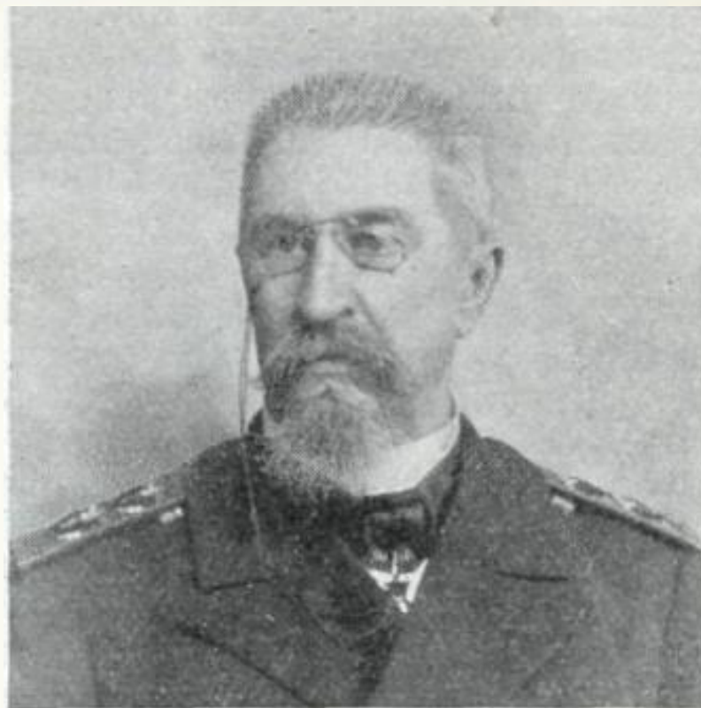
Вице-адмиралъ П. А. Безобразовъ, назначенный командующимъ первой эскадрой флота Тихаго океана и отбывшій къ мѣсту назначенія 21-го апрѣля т. г.

С другой стороны, часть правящих кругов занимала экспансионистские позиции, выступала за дальнейшие территориальные приобретения (А. М. Безобразов («Безобразовская клика»), А. П. Извольский, С. Д. Сазонов).