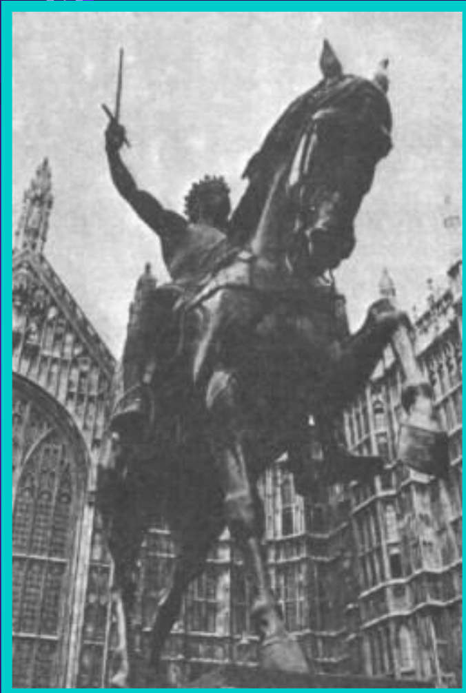
Памятник Ричарду Львиное Сердце у английского парламента.

По приказу Ричарда англичане перебили в Акре 2 тысячи мусульман.