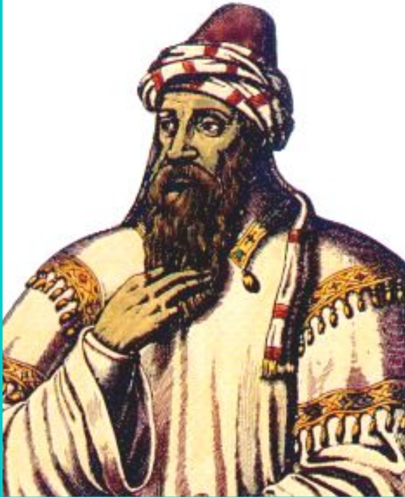
Салах-Дин. Рисунок с арабской миниатюры

Успехи мусульман привели к тому что папа объявил о третьем крестовом походе.