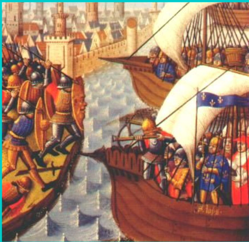
Пираты и крестоносцы.

В 1212 г. в поход вновь двинулись толпы бедняков по призыву проповедника Франциска Алоизского. Добравшись до Генуи бедняки разделились. Часть детей купцы посадили на корабли, но суда попали в бурю. Уцелевшие участники похода были проданы в рабство.