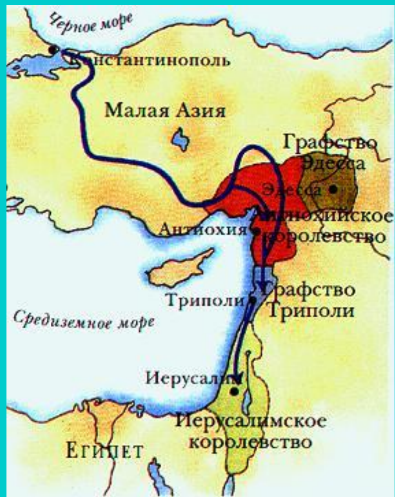
Государства крестоносцев в Малой Азии.

Со временем владения крестоносцев в Палестине уменьшались. С развитием хозяйства рыцарям стало выгоднее заниматься поместьем, чем воевать.