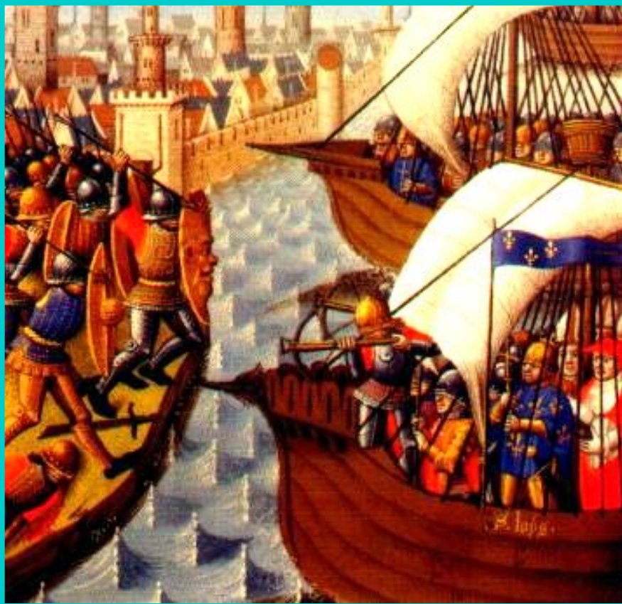
Пираты и крестоносцы.

В 1212 г. в поход вновь двинулись толпы бедняков по призыву проповедника Франциска Алоизского. Добравшись до Генуи бедняки разделились. Часть детей купцы посадили на корабли, но суда попали в бурю. Уцелевшие участники похода были проданы в рабство.