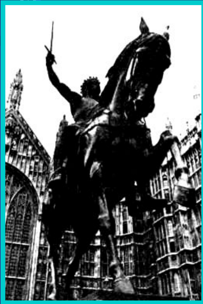
Памятник Ричарду Львиное Сердце у английского парламента.

По приказу Ричарда англичане перебили в Акре 2 тысячи мусульман.