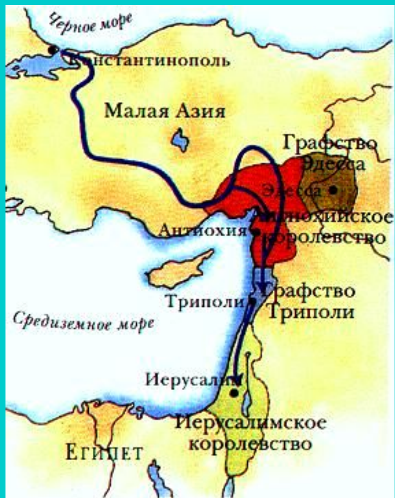
Государства крестоносцев в Малой Азии.

Со временем владения крестоносцев в Палестине уменьшались. С развитием хозяйства рыцарям стало выгоднее заниматься поместьем, чем воевать.