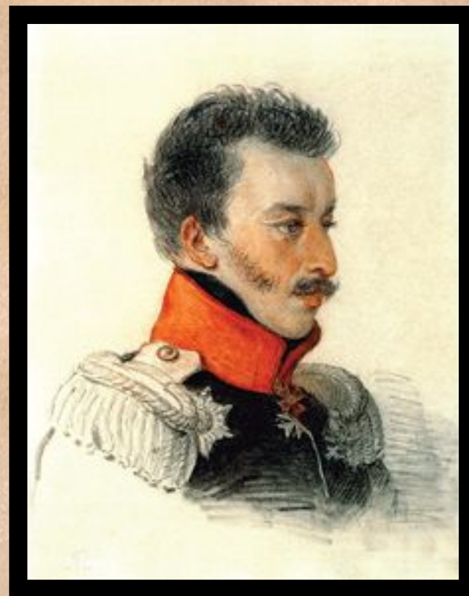
Сергей Григорьевич Волконский (8 декабря 1788 - 28 ноября 1865) — герой Отечественной войны 1812 года, декабрист