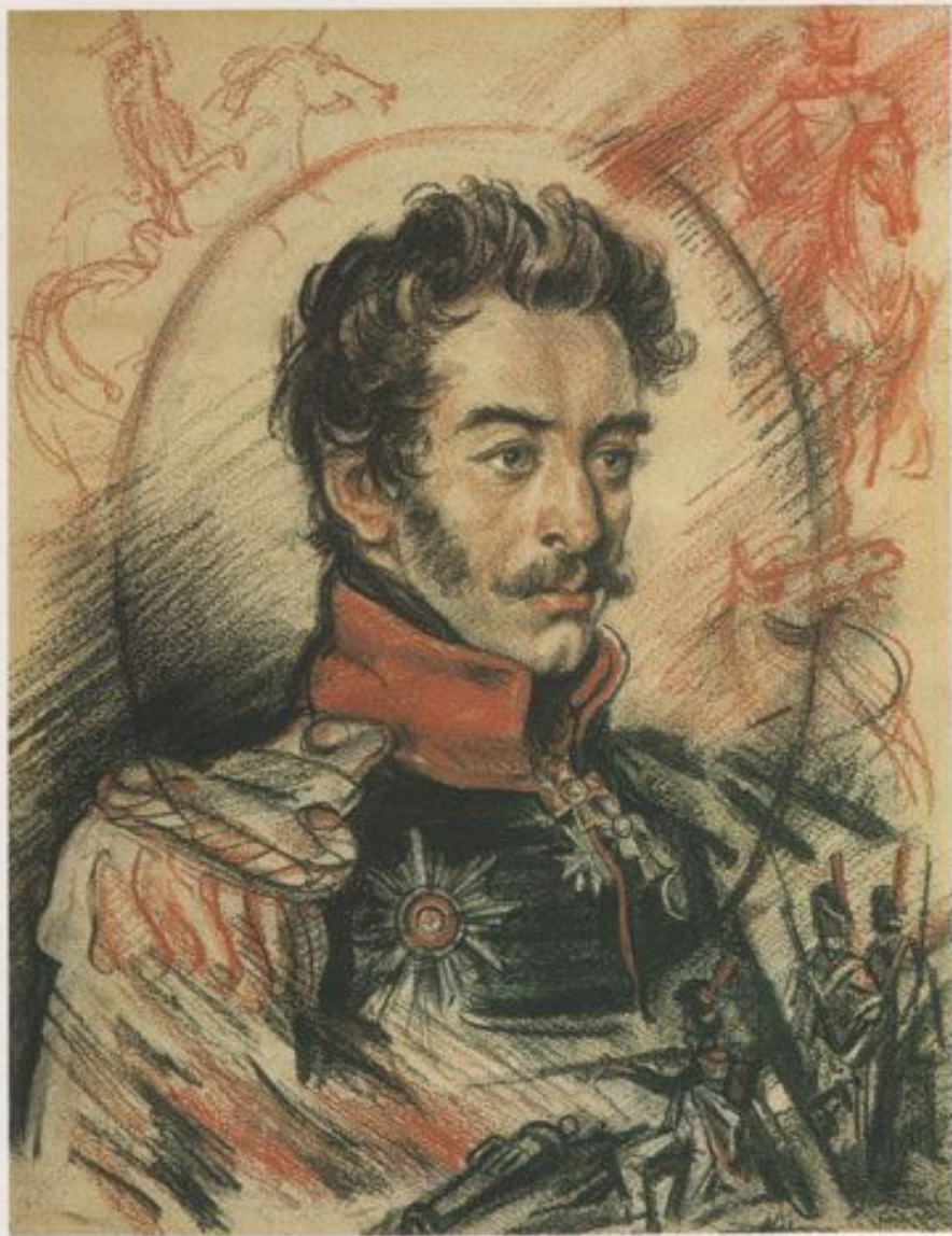
Сергей Григорьевич Волконский 1788—1865