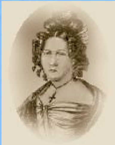
Мария Николаевна Раевская.