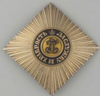
Знак 4-й степени