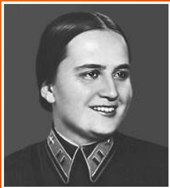
М. М. Раскова