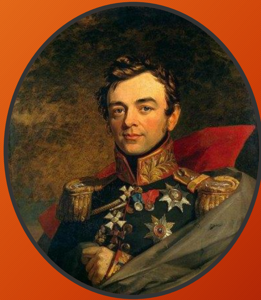
граф, генерал-фельдмаршал И. Ф. Паскевич-Эриванский князь Варшавский