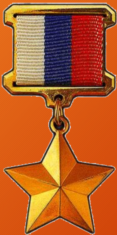
Золотая звезда Героя Российской Федерации