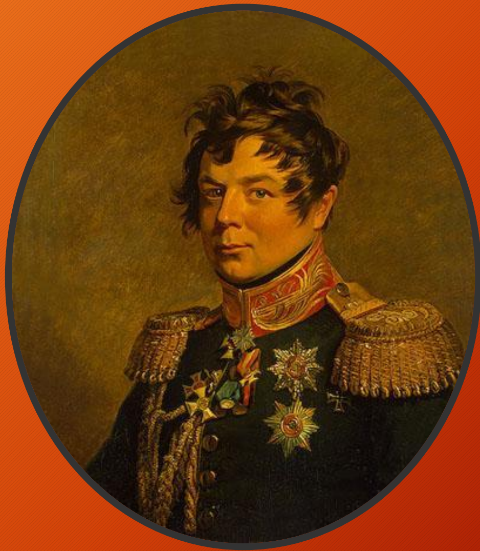
граф, генерал-фельдмаршал И. И. Дибич-Забалканский.