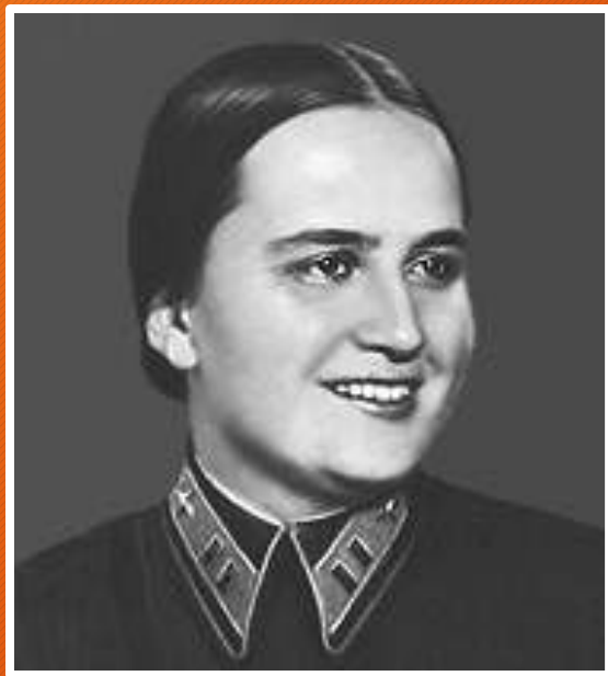
М. М. Раскова