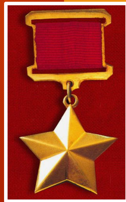
Медаль Героя Советского Союза