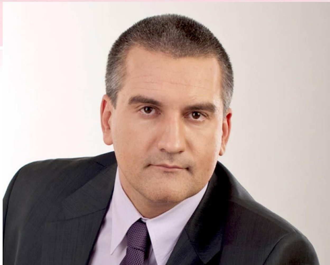
Глава Республики Крым Сергей Валериевич Аксёнов