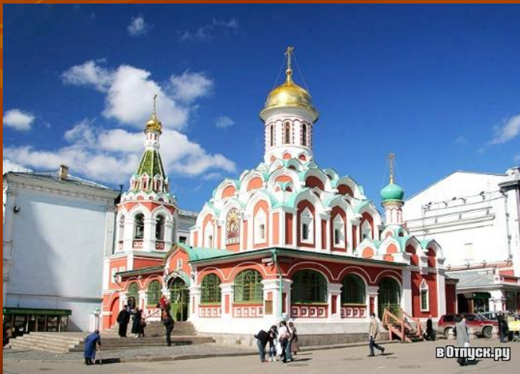
Алексей Михайлович Романов (1645-1676)