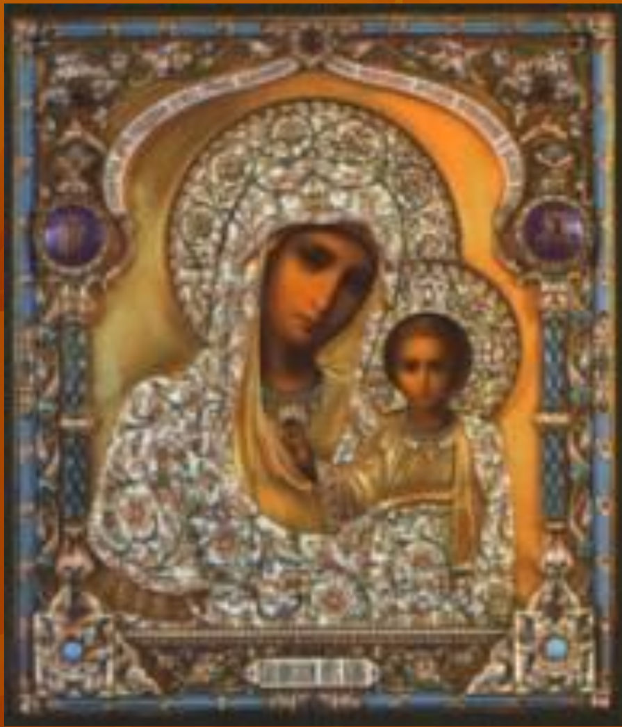
икона Пресвятой Богородицы Казанской

С чудотворной иконой Казанской Божией Матери, явленной в 1579 году, Нижегородское земское ополчение сумело взять штурмом Китай-город и изгнать поляков из Москвы.