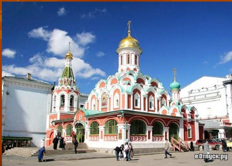
Алексей Михайлович Романов (1645-1676)