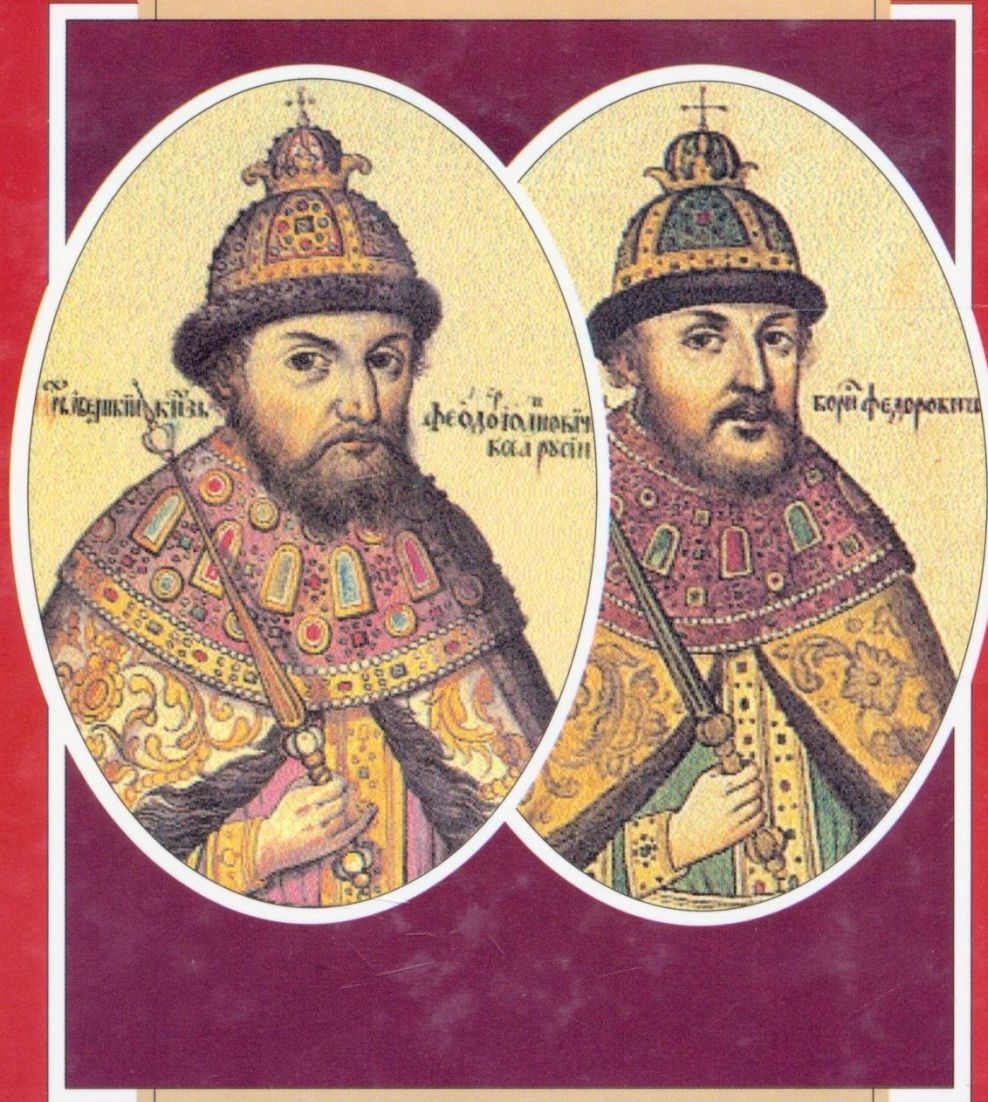
ДВА ЦАРЯ: ФЕДОР И БОРИС