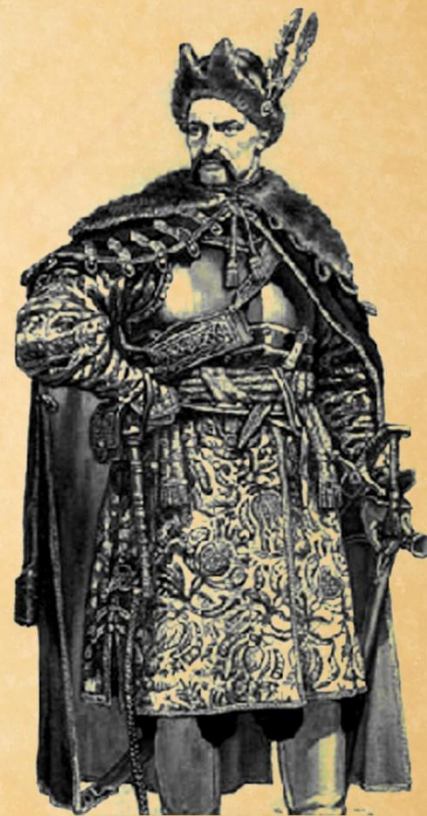
КАЗАК ИВАН ЗАРУЦКИЙ