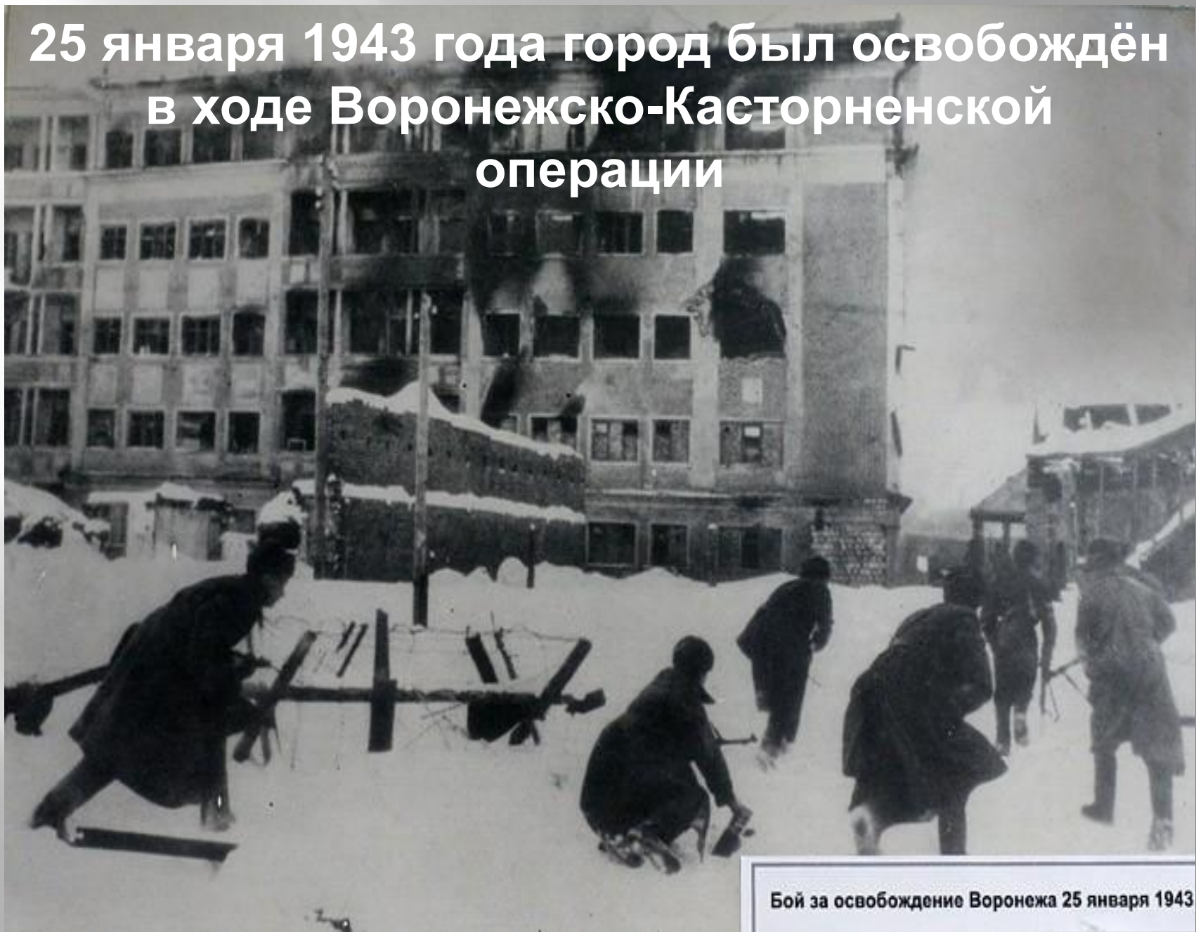
Бой за освобождение Воронежа 25 января 1943