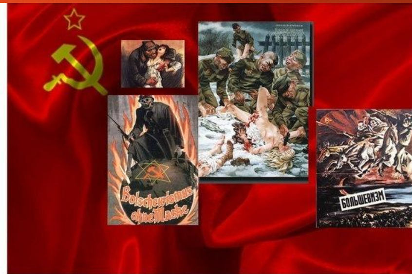
Когда говорят о зверствах Красной Армии, показывают картины