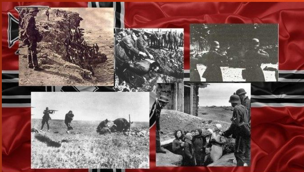
Когда говорят о зверствах Вермахта, показывают фотографии