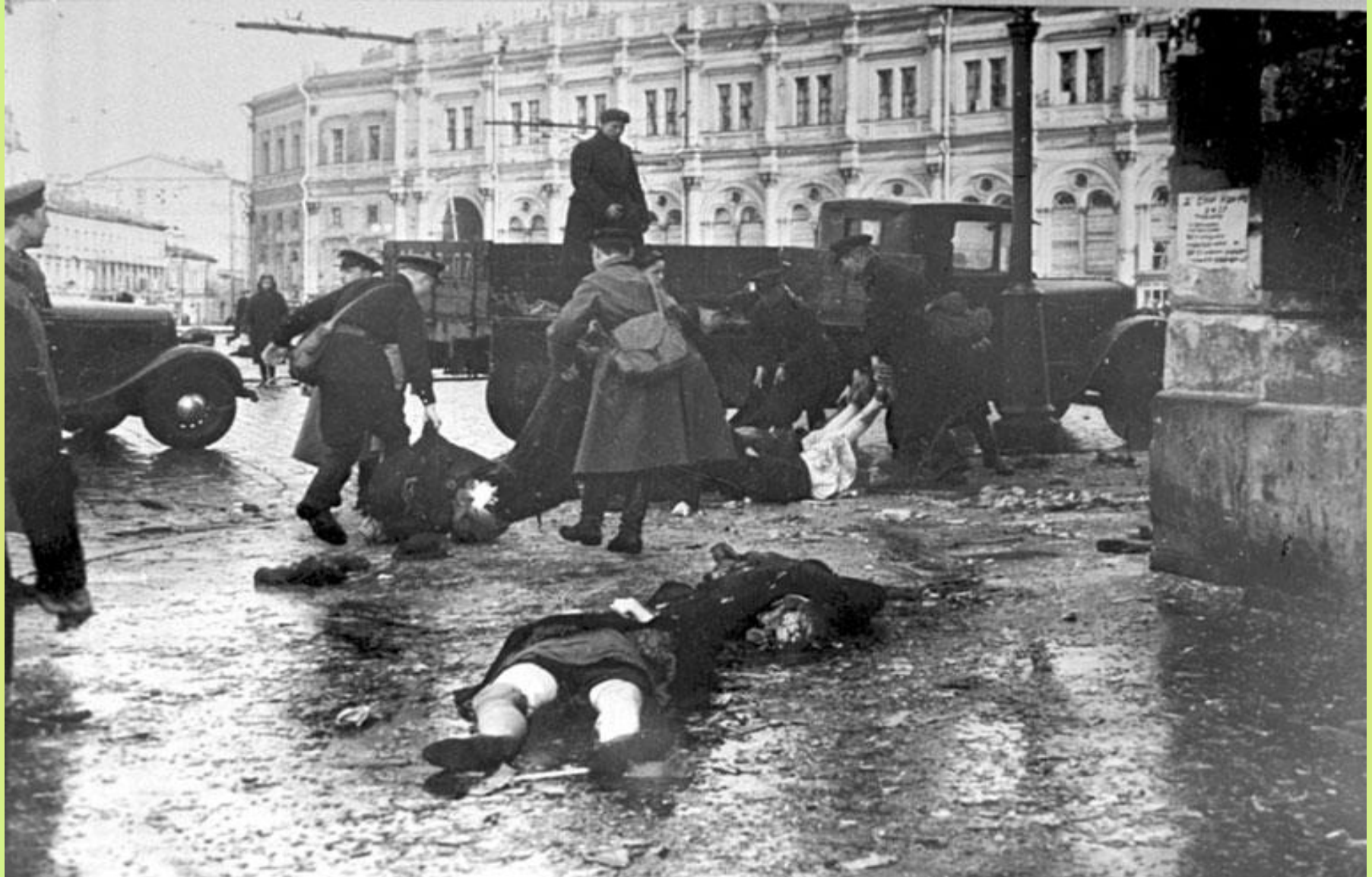
Октябрь 1941 г. Место съемки: г. Ленинград