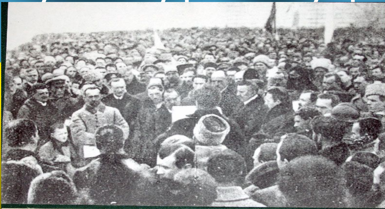
Мітинг на Софійському майдані у Києві з нагоди проголошення Акту злуки Української Народної Республіки та Західно-Української Народної Республіки в єдину соборну державу. 22 січня 1919 р.

7 листопада 1917 р. була проголошена Українська Народна Республіка, до складу якої увійшло 9 українських губерній.