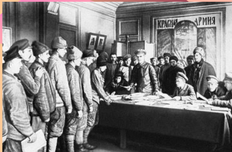
Запись добровольцев в Красную Армию