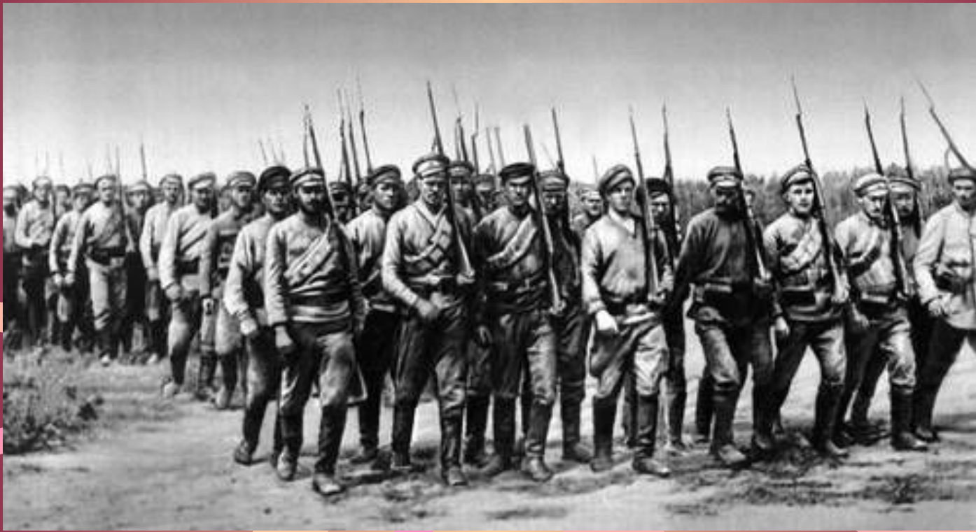
Один из первых полков Красной Армии