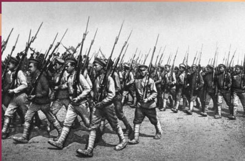
Парад частей Красной Армии