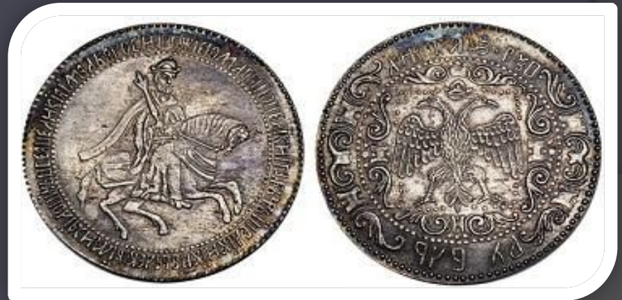
Российский серебряный рубль