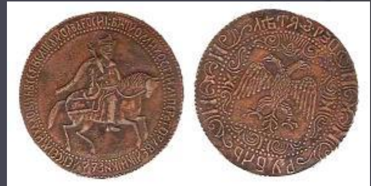
Медный российский рубль