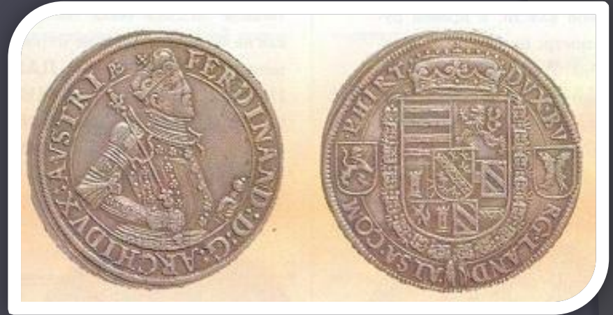
Западноевропейский серебряный талер