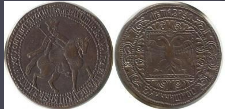
Медный российский полтинник (копия)