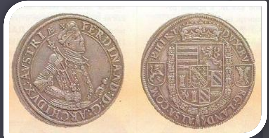
Западноевропейский серебряный талер