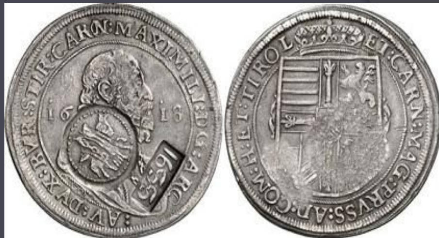
Ефимок с признаком на талере Максимилиана Тирольского 1618 г