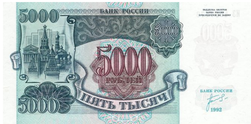
5000 рублей 1992 г. — старые деньги