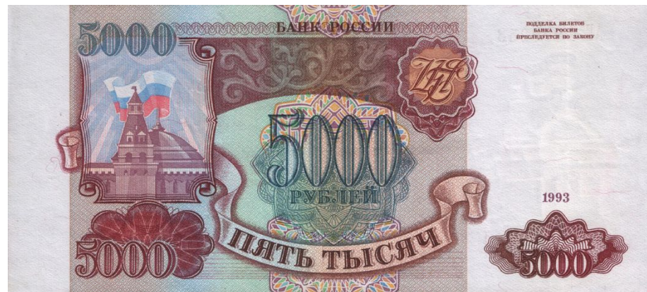
5000 рублей 1993 г. — новые деньги