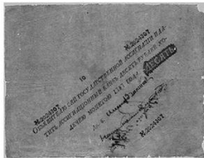
Ассигнация в 10 рублей 1787 г.

Ассигнации имели достоинство 10, 25, 50, 75 и 100 руб., печатались на плотной белой бумаге со сложными водяными знаками и овальными тиснениями. Каждая ассигнация содержала подписи двух сенаторов, советника и директора банка. Разменными к ассигнациям были медные монеты.