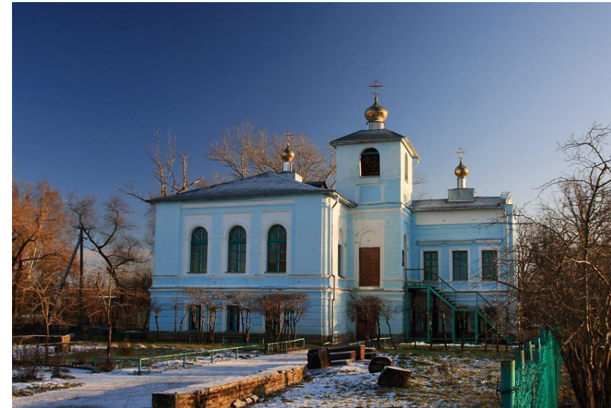
Храм в честь Иконы Божией Матери Сподручница грешных