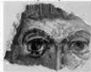
Фреска Досвітньої церкви

Датування Софії 1011 - 1018 рр. підтверджується ретельним аналізом складу фрескової тиньки і позив'яних плит підлоги Досвітньої церкви і Софії Київської. Доведено, що за технологічними ознаками фрескової тиньки і плиток'які є части підлоги обох храмів є повністю ідентичними. Так само і стіни і колонни цих храмів виявляють собою фактично аналогії. Це об'єктивно свідчить про спільну архітектурну і технологічну базу обох храмів, побудованих майстрами з Троїцької, заснованих Володимиром наприкінці X ст. для обслуговування Досвітньої церкви.