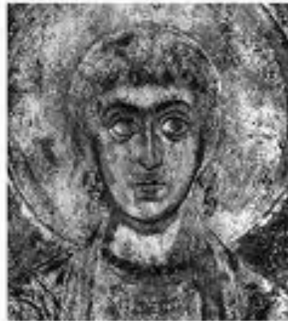
Св. Діва Фреска Софії Князьини

Розкопки руїн почалися ще в 30-х роках XVII століття за ініціативи митрополита Петра Могили. Далі розкопки проводились у 1824 році К. А. Лохвицьким, у 1826 році - Єфимовим, у 1908-14 роках - археологом Д. В. Милеєвим. Під час розкопок було знайдено чимало цінних фрагментів мозаїки підлоги, фрескового і мозаїчного прикрашень храму, кам'яні захоронення, залишки фундаменту тощо.