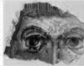
Фреска Десятинної церкви

Датування Софії 1011 - 1018 рр. підтверджується ретельним аналізом складу фрескової фарби і позив'яних плит підлоги Десятинної церкви і Софії Київської. Доведено, що за технологічними ознаками фресковий тип фарби і способи підлоги обох храмів є повністю ідентичними. Так само і способи облицювання цих храмів виявляють собою близькі аналоги. Це об'єктивно свідчить про спільну архітектурну традицію обох храмів, побудованих майстрами з Троєцької, заснованих Володимиром наприкінці X ст. для обслуговування Десятинної церкви.