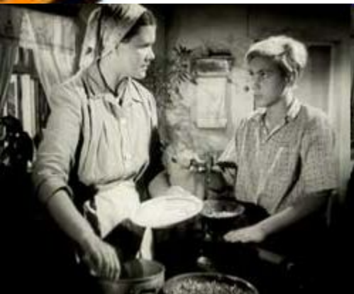
Кадр из фильма «Орлёнок»