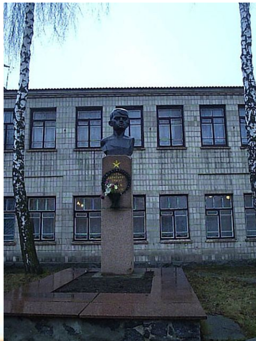
Улица В. Котика в Шепетовке