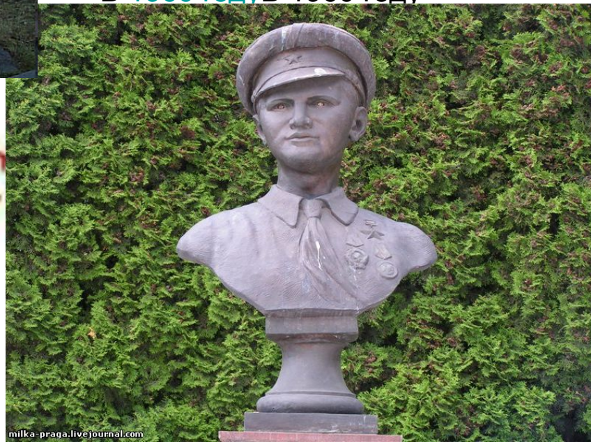
Памятник на ВВЦ