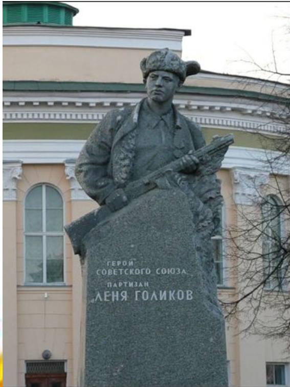
Памятник Лёне Голикову в Великом Новгороде