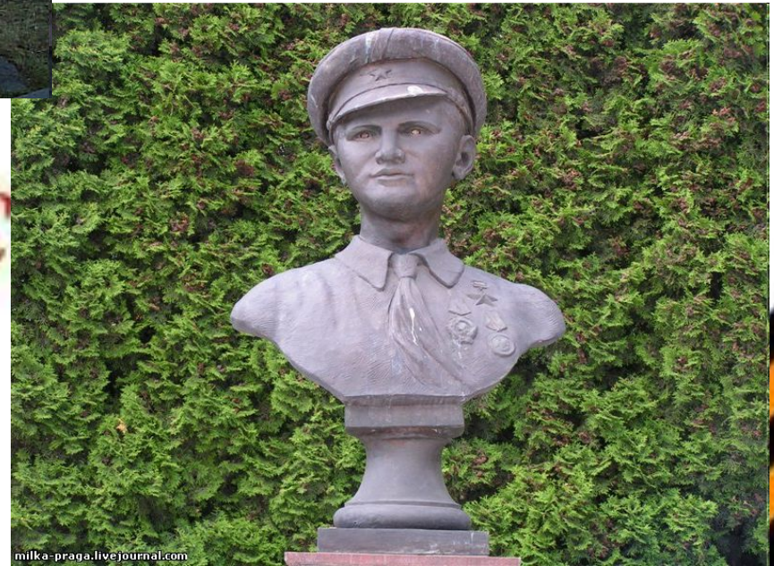
Памятник на ВВЦ