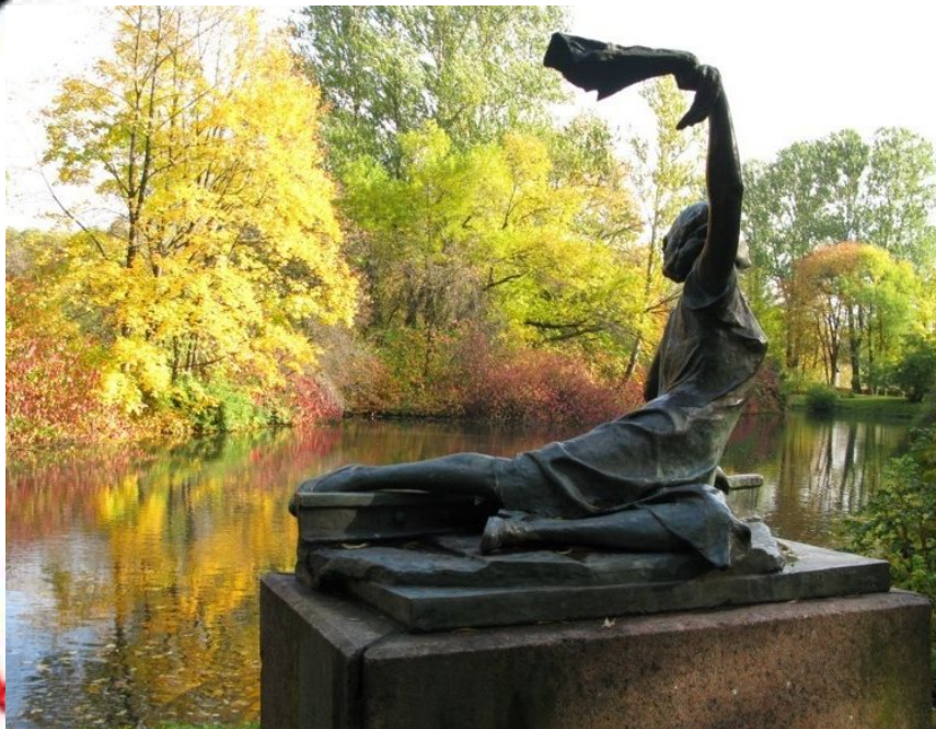
Памятник З. Портновой в Витебске