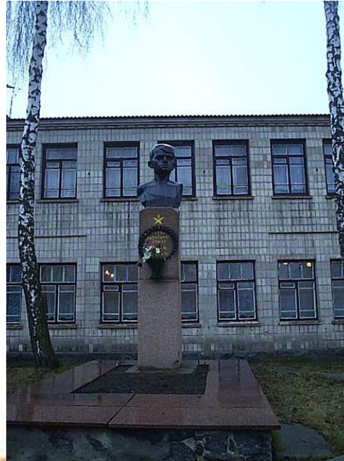
Улица В. Котика в Шепетовке