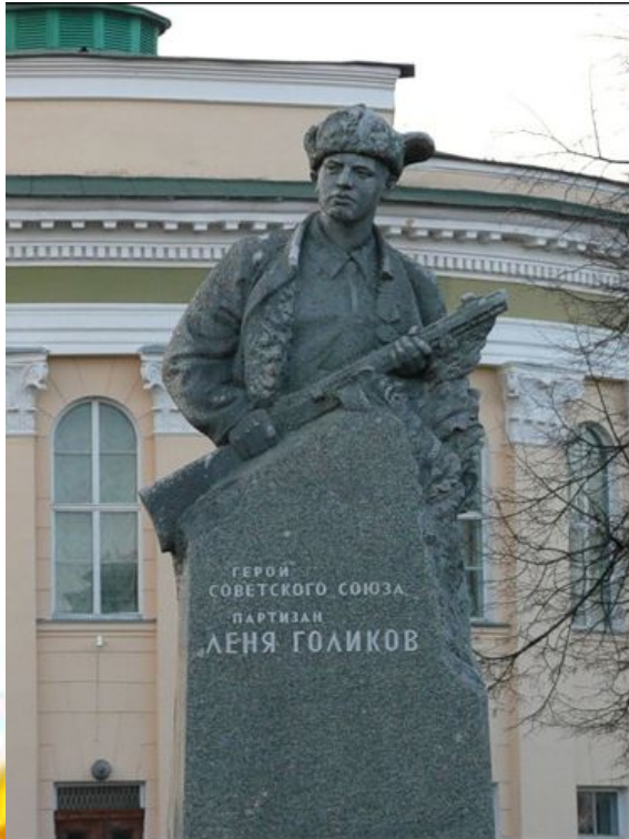
Памятник Лёне Голикову в Великом Новгороде