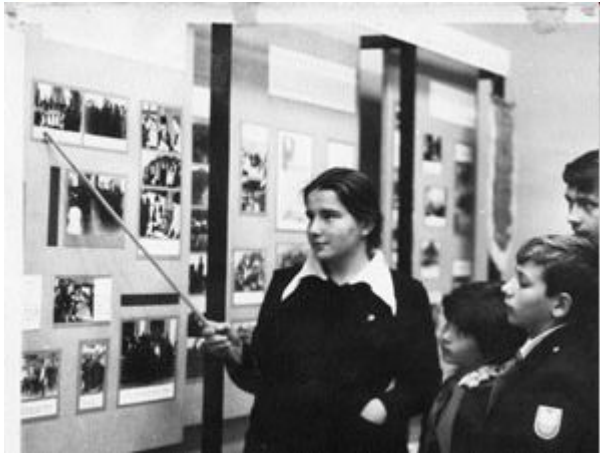
Музей В. Дубинина в школе № 1 г. Керчи