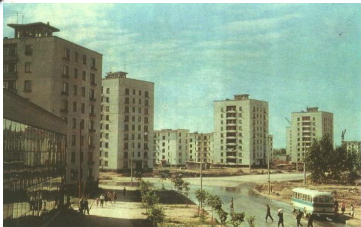
Улица Зины Портновой в ★ Санкт - Петербурге