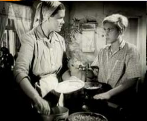
Кадр из фильма «Орлёнок»