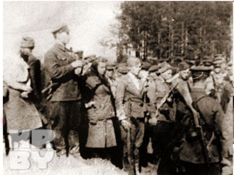
Похороны М. Казея в деревне Хоромецкие