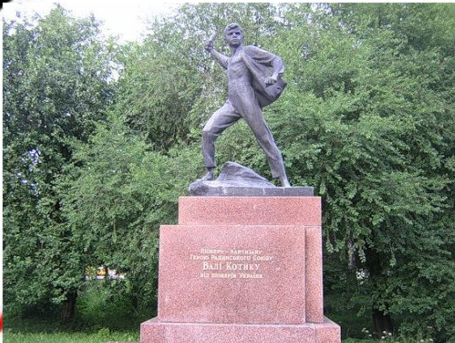
Памятник Вале Котику в Шепетовке