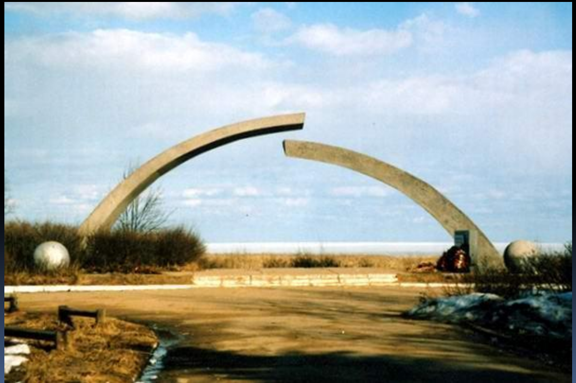
Памятник "Разорванное кольцо"

Через торосы Ладожского льда, Отсюда мы вели Дорогу жизни. Чтоб жизнь не умирала никогда".