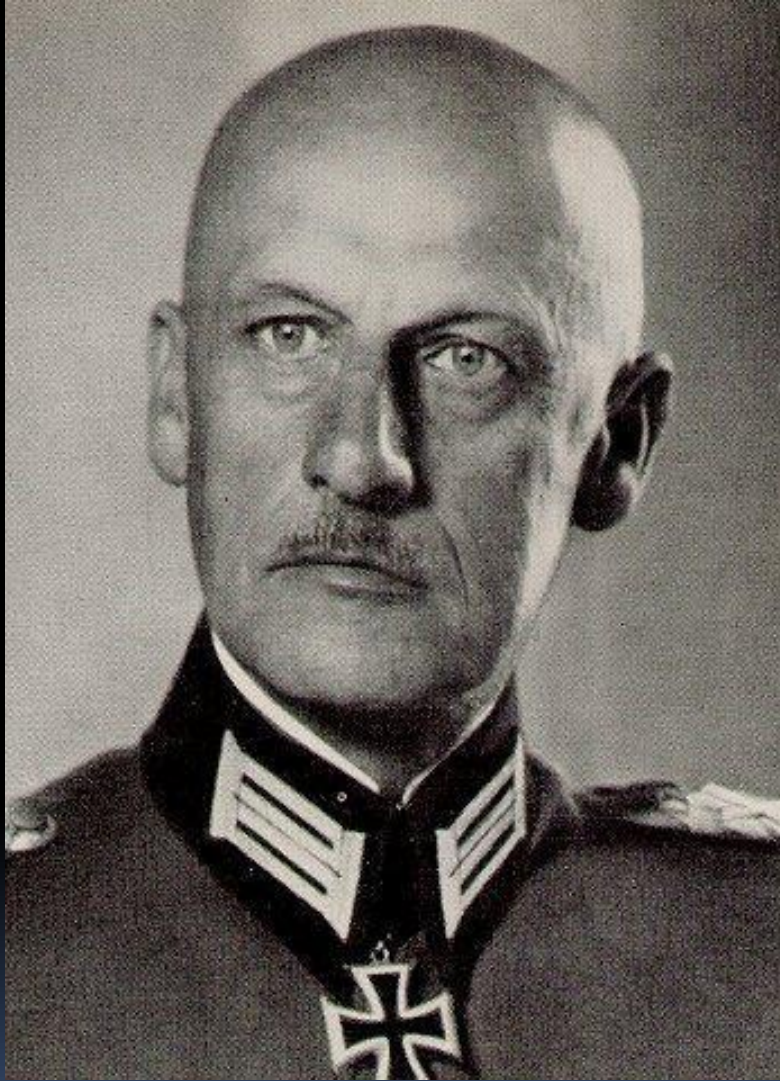
Фельдмаршал Фон Лееб

Летом 1941 года на Ленинград шла группа армий "Север", общей численностью 500 тысяч человек, под командованием генерал-фельдмаршала фон Лееба.