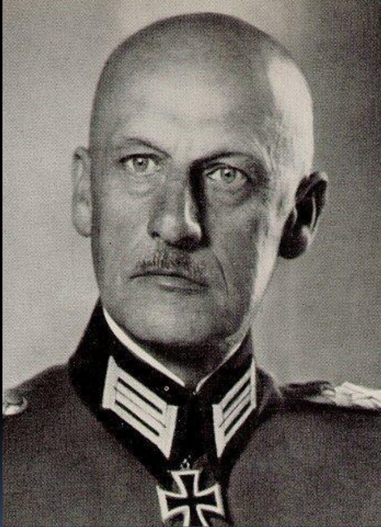
Фельдмаршал Фон Лееб

Летом 1941 года на Ленинград шла группа армий "Север", общей численностью 500 тысяч человек, под командованием генерал-фельдмаршала фон Лееба.