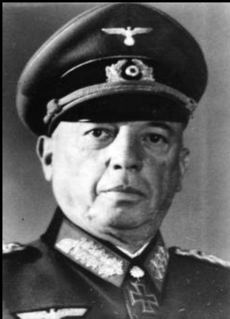
Генерал- полковник Кюхлер

8 сентября 1941 года гитлеровцы захватили у истока Невы город Шлиссельбург, окружив Ленинград с суши.