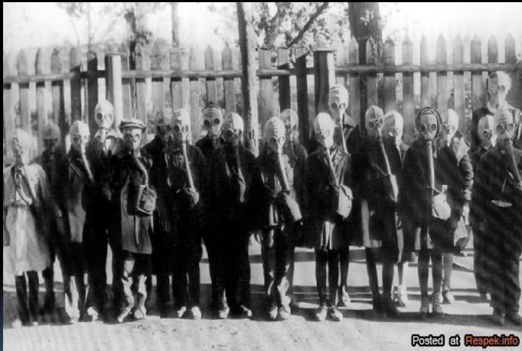
Тренировочная эвакуация учащихся