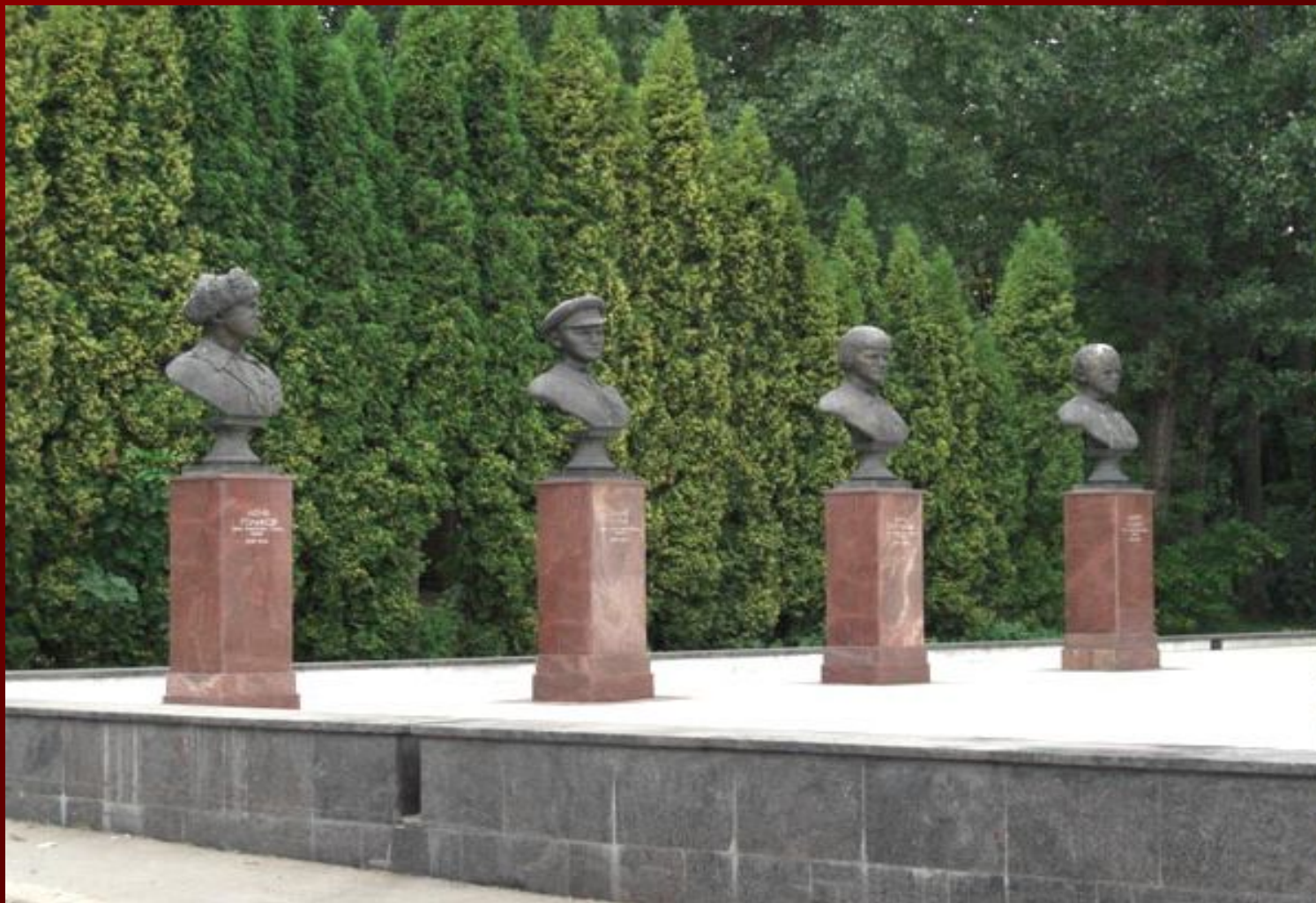
Мемориал пионерам-героям Советского Союза, ВДНХ, Москва