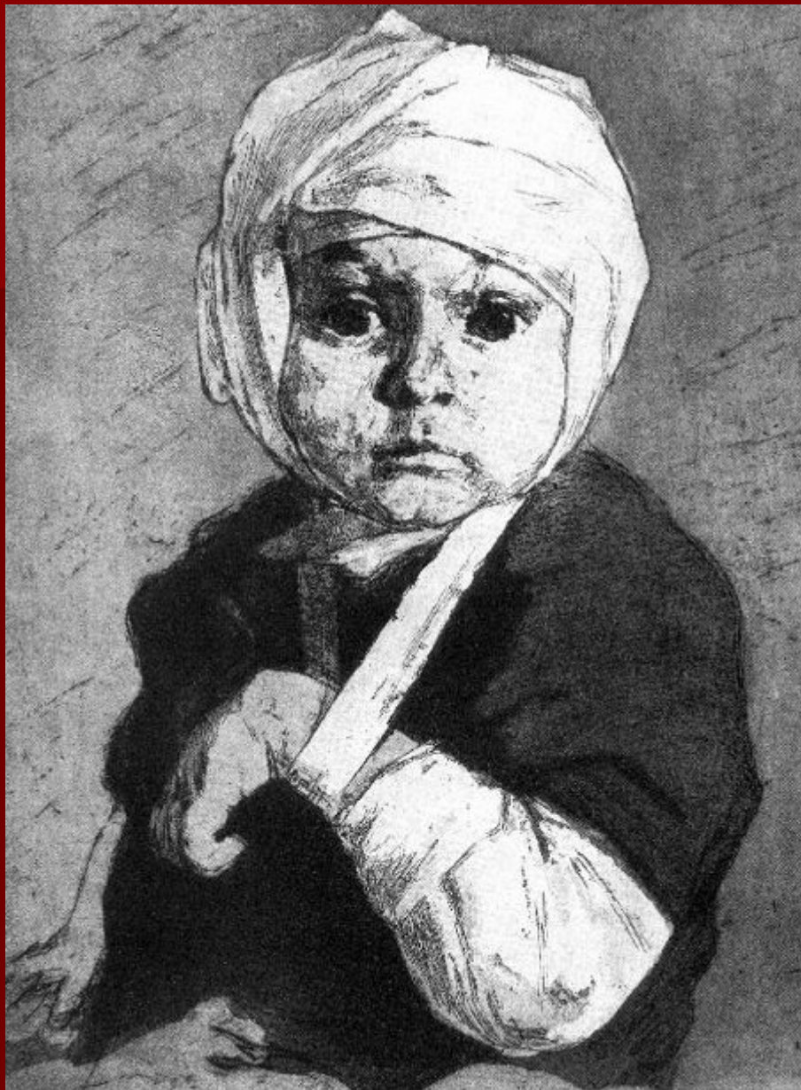
А. Харшак «За что?» (Раненый ребенок) 1942