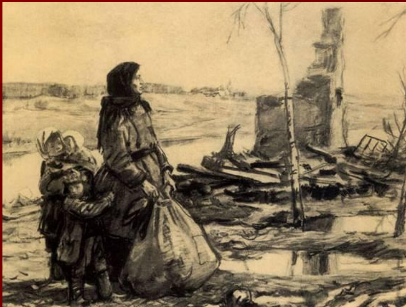
Д.Шмаринов. «Не забудем, не простим»