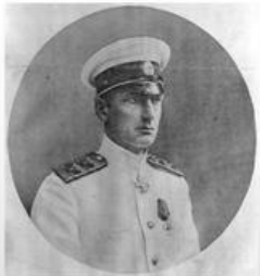
А. В. Колчак