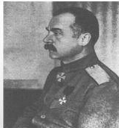
А. М. Каледин