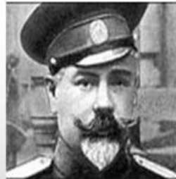
А. И. Деникин