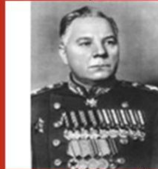
С. М Будённый