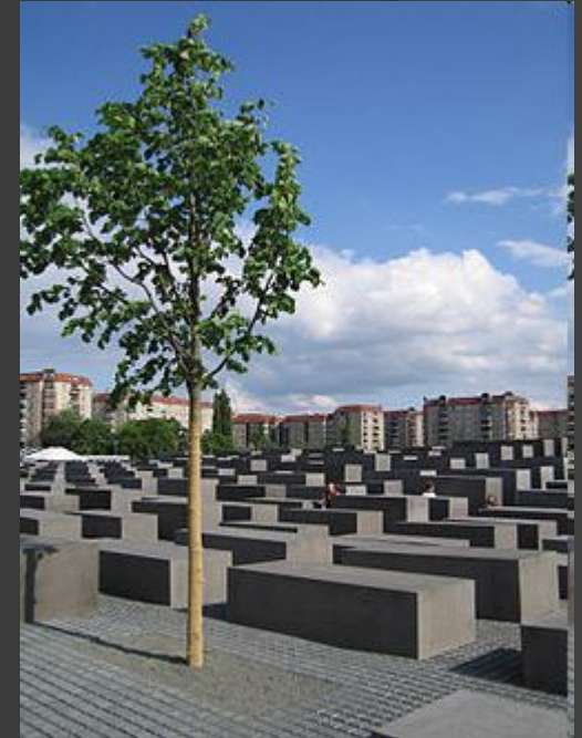
Мемориал памяти убитых евреев Европы в Берлине

Преднамеренная попытка полного истребления целой нации, включая мужчин, женщин и детей, приведшая к уничтожению 60 % евреев Европы и около трети еврейского населения мира. Кроме того, были уничтожены также от четверти до трети цыганского народа , потери поляков (не включая военные потери и потери от истребления литовскими и украинскими коллаборационистами) составили 10 %, погибли около 3 миллионов советских военнопленных , подвергались тотальному истреблению также чернокожие граждане Германии, душевнобольные и нетрудоспособные и т.д.