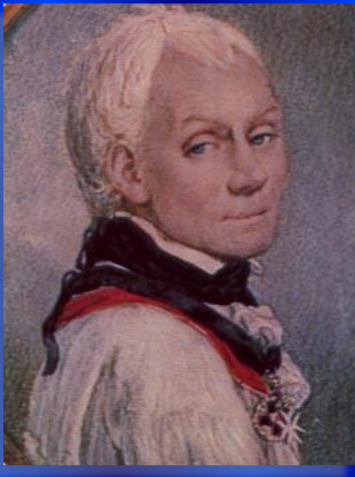
А.В. Суворов. Миниатюра Ксавье де Местра

Существует несколько вариантов легенды о встрече юного Суворова с генералом Ганнибалом, которую принято считать своеобразным благословением будущего полководца на военную службу Вот один из вариантов.