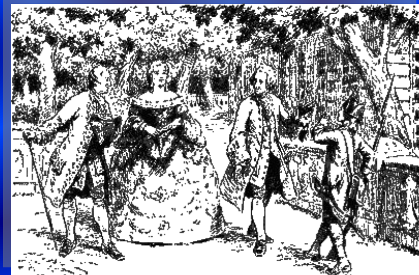
Иллюстрация к рассказу С.Т.Григорьева «Детство Суворова».

Кроме этого, в записи полка от 25 октября 1742 г., в который поступал Суворов, описано, что отроду ему 12 лет и было это записано по словам самого Суворова (то есть дата рождения — 1730 год). Назван Александром в честь Александра Невского.