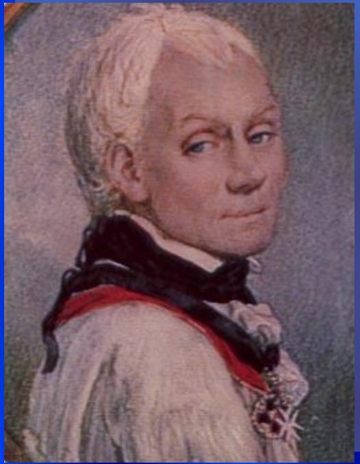
А.В. Суворов. Миниатюра Ксавье де Местра

Существует несколько вариантов легенды о встрече юного Суворова с генералом Ганнибалом, которую принято считать своеобразным благословением будущего полководца на военную службу. Вот один из вариантов.