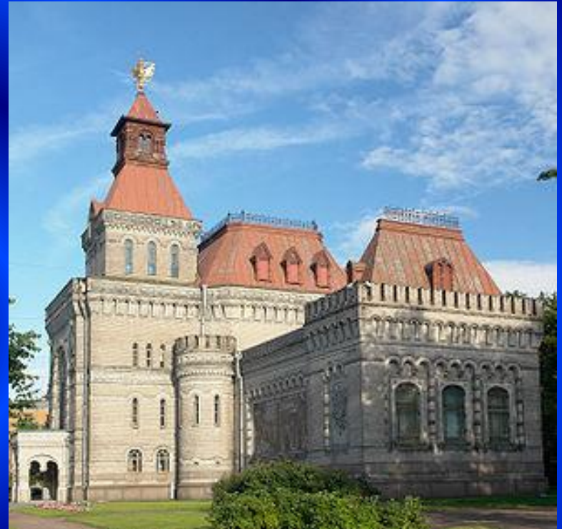
Мемориальный музей Суворова

Суворов был первым человеком, в честь которого в России был основан мемориальный музей, в Санкт-Петербурге в 1900 году, к столетней годовщине со дня смерти полководца. Торжественно открыт четырьмя годами позже, 13 (26) ноября 1904 года к 175-й годовщине со дня рождения Суворова, при участии императора Николая II.