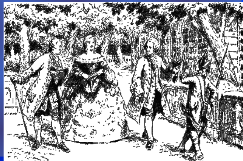
Иллюстрация к рассказу С.Т.Григорьева «Детство Суворова».

Кроме этого, в записи полка от 25 октября 1742 г., в который поступал Суворов, описано, что отроду ему 12 лет и было это записано по словам самого Суворова (то есть дата рождения — 1730 год). Назван Александром в честь Александра Невского.