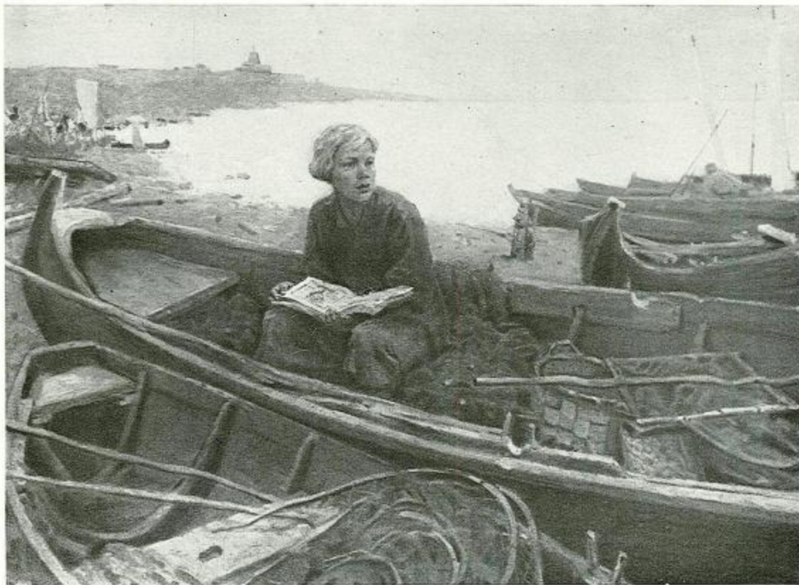
54. Ломоносов на родине. Картина О. А. Кочарова, 1954 г., холст, масло. Республиканский художественный музей. Кишинев (см. стр. 39).

Работа в суровом холодном море сделала Михайлу упорным, сметливым. Научила быть наблюдательным, выносливым, не бояться невзгод и трудностей.