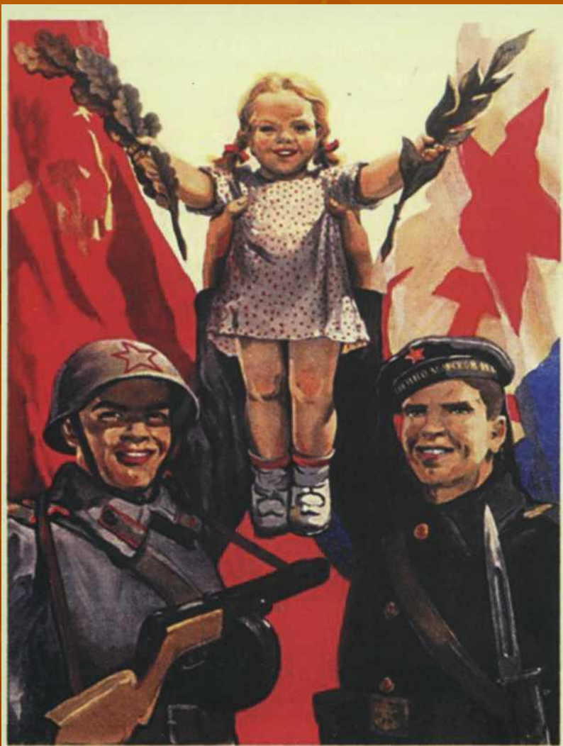
Плакат В. Иванова, 1944 г.

«То, что выпало на долю наших воинов, всего нашего народа, никогда еще не выпадало ни на чью долю. Эта война была самой кровопролитной и разрушительной из всех войн в истории человечества. ...Кто думает о прошлом, тот имеет ввиду и будущее. Кто говорит о будущем, тот не имеет права забыть о прошлом»