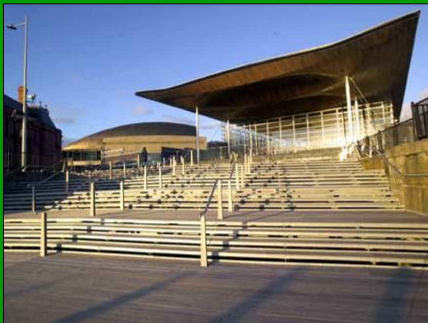
Здание Национальной Ассамблеи в Кардиффе - Senedd

Llywodraeth Cynulliad Cymru Welsh Assembly Government