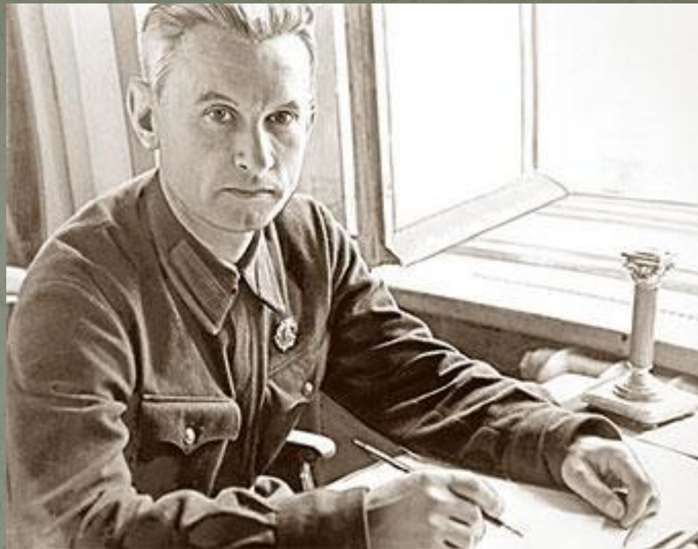
Александр Фадеев в блокадном Ленинграде.