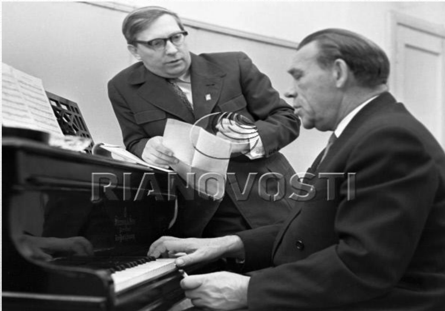
Композитор Анатолий Новиков (слева) и поэт Лев Ошанин (справа) работают над песней «Дороги»