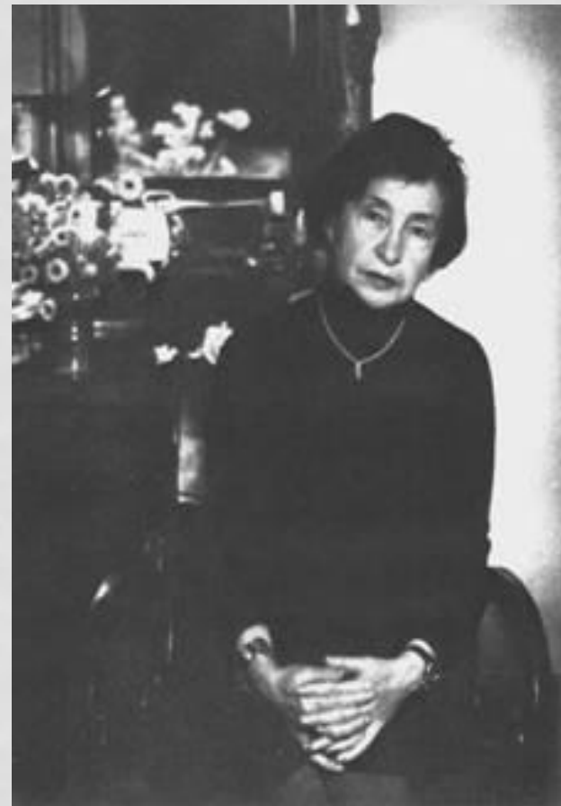
Маргарита Алигер, 1941 год