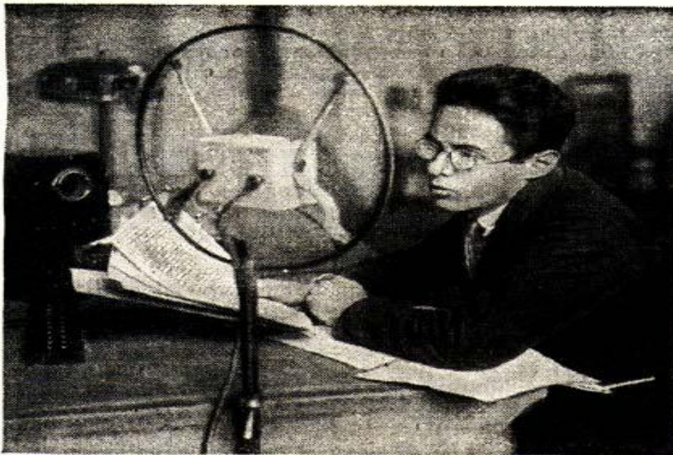
Юрий Левитан. (Июль 1941 года).