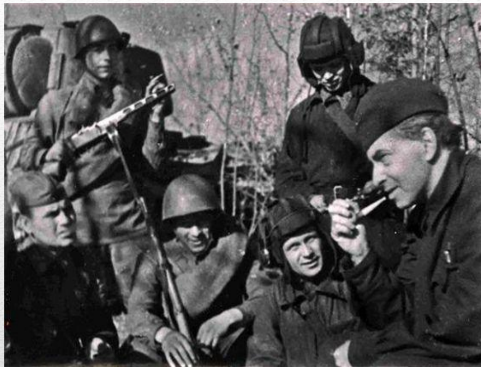
Илья Эренбург (справа) с танкистами на фронте, 1942 год