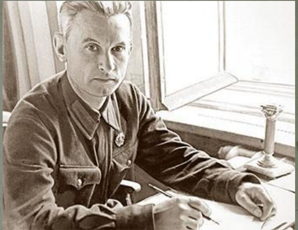
Александр Фадеев в блокадном Ленинграде.