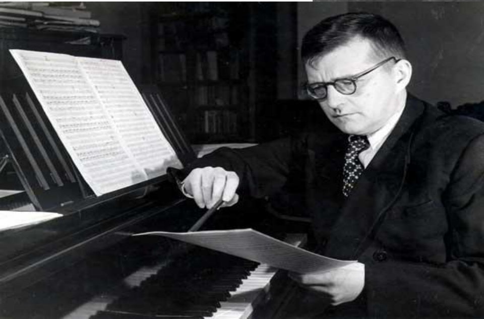
Дмитрий Дмитриевич Шостакович