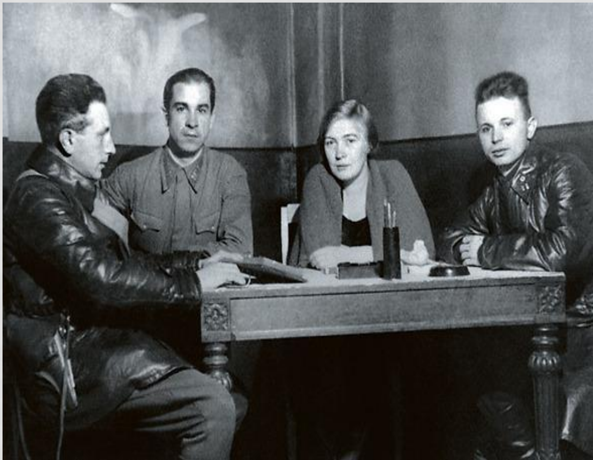
Ольга Берггольц на Ленинградском фронте, 1941 год