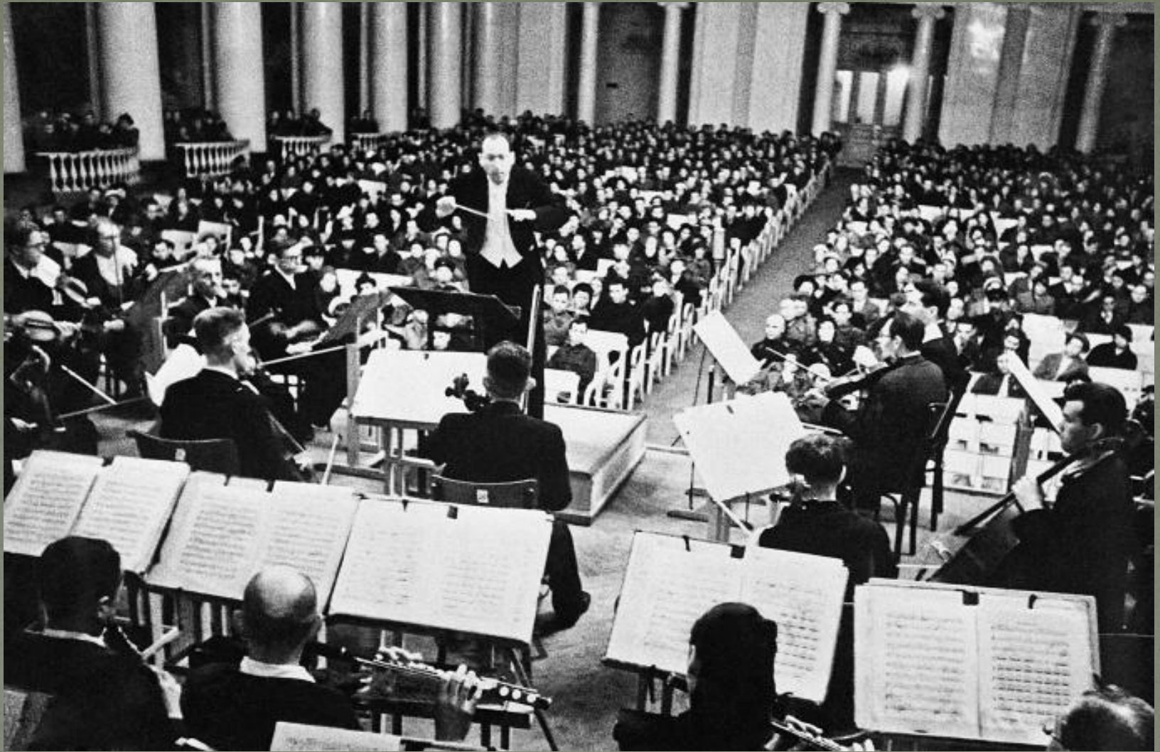
Исполнение 7-ой симфонии. Дирижер – Карл Элиасберг. Ленинград, 1942 год