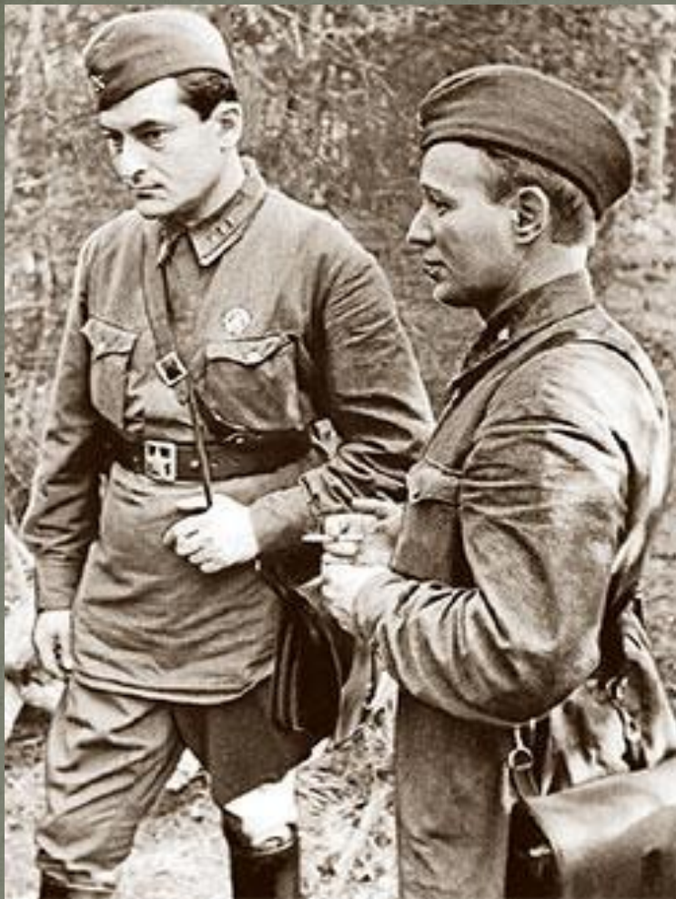
Евгений Петров и Михаил Шолохов на Западном фронте. 1941 г.