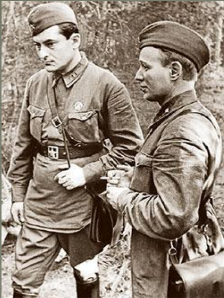
Евгений Петров и Михаил Шолохов на Западном фронте. 1941 г.