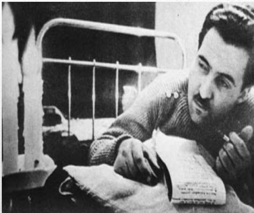
Константин Симонов, Северный фронт, 1941 год