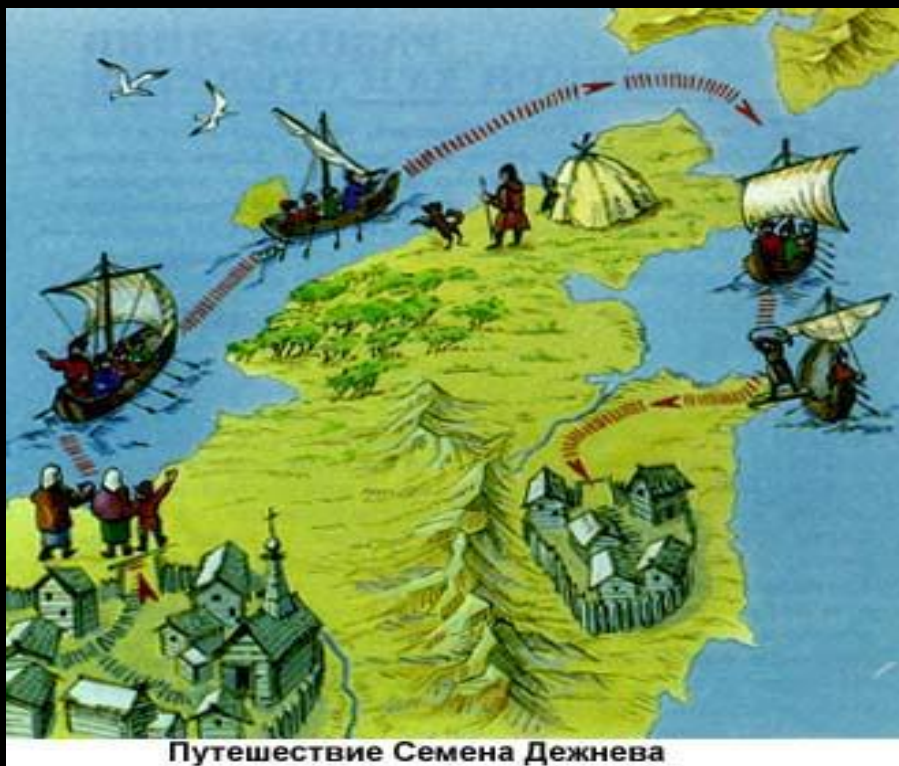
Путешествие Семена Дежнева

В 1648 г. Дежнев вошел в состав промысловой экспедиции Федота Попова. Летом 7 кочей вышли в Северной Ледовитый океан. Экспедиция была очень тяжелой: лишь трем кораблям удалось пройти до восточной оконечности побережья и обогнуть «Большой каменный нос».