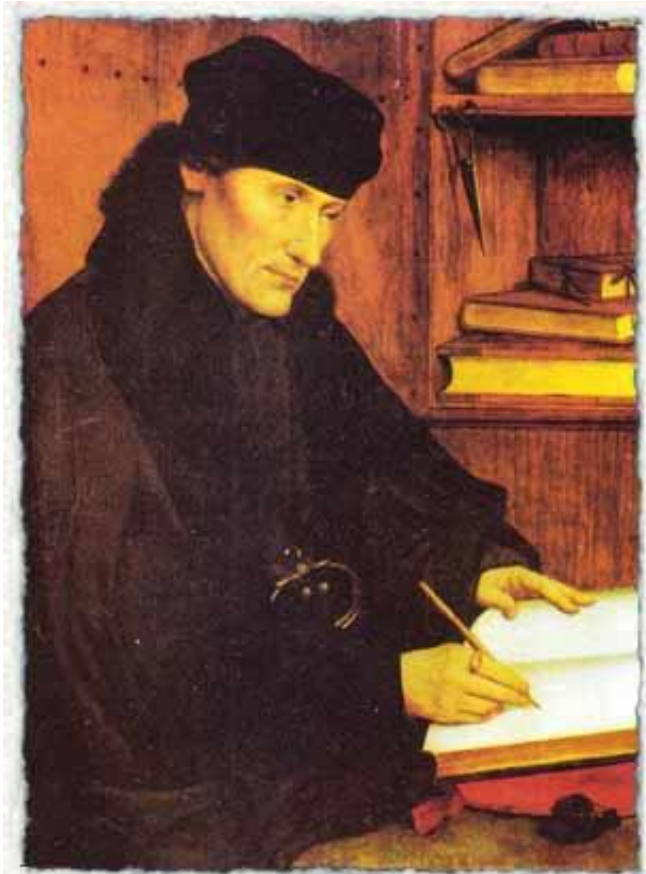
1517 г. Эразм Роттердамский. Картина Квентина Массейса. Дворец Барберини. Рим.

На этот раз Эразм нашёл себе могущественного мецената в лице императора Священной Римской империи Карла Испанского (будущего императора Карла V ).