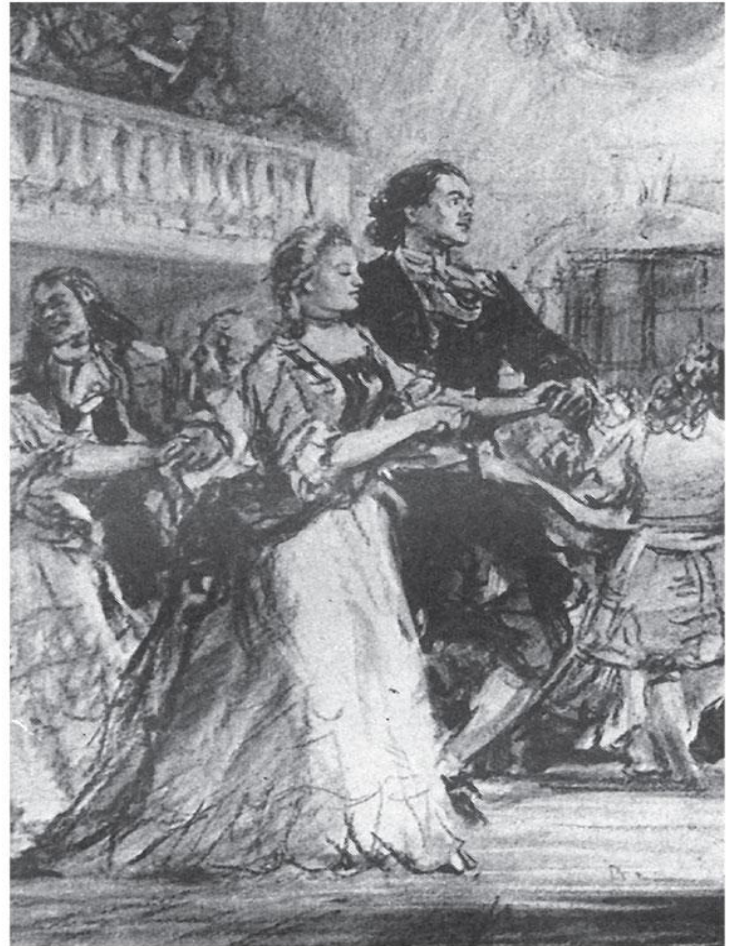
Д. А. Шмаринов. Анна Монс и Петр I на балу в Немецкой слободе