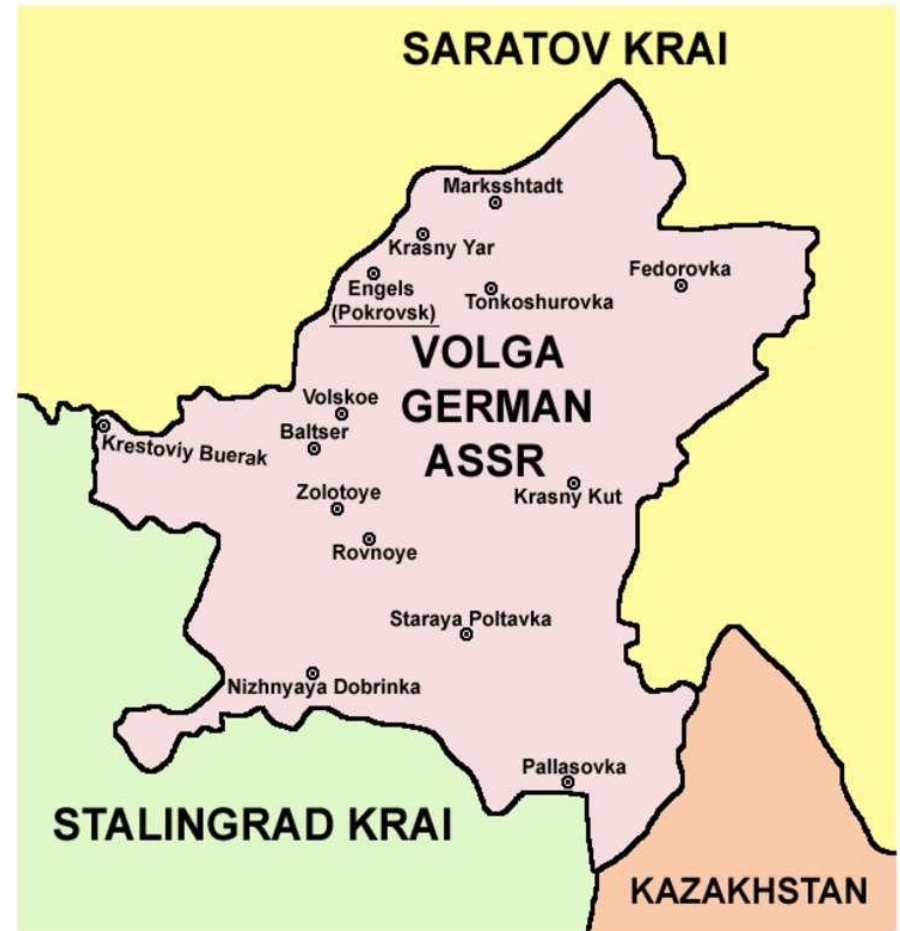
Volga German Autonomous Soviet Socialist Republic in 1924-1941