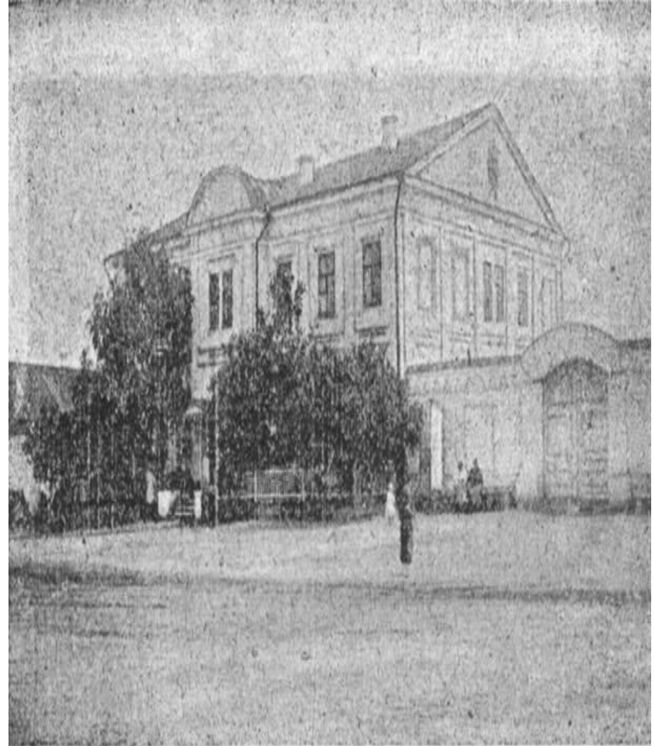
Desnot Karamyſch (Grimm). Die Kreisſchule.