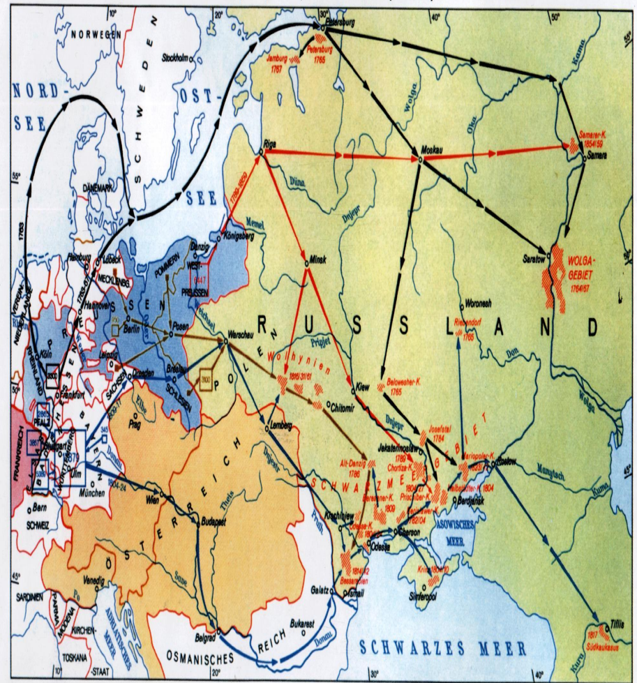
Auswanderung von Deutschen in das Schwarzmeer- und Wolgagebiet (Russland) im 18. und 19. Jh. Переселение немцев в Причерноморье и Поволжье (Россию) в XVIII и XIX веках

Die ersten Deutschen aus dem Rheinland, aus Hessen und Sachsen fuhren mit dem Schiff über die Ostsee nach Sankt Petersburg. Von dort fuhren sie mit dem Pferdewagen weiter. Die Reise dauerte ein ganzes Jahr! Und sie war nicht einfach, das könnt ihr euch sicher vorstellen. Die kürzeste Reise hatten die Deutschen, die in Kolonien in der Nahe von Sankt Petersburg blieben. Die anderen fuhren weiter – an die Wolga.