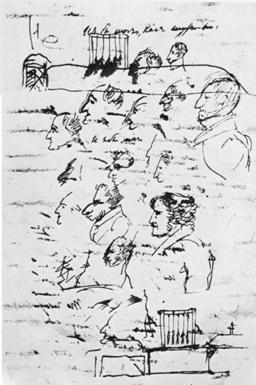
Рис. А.С. Пушкина. Казнь декабристов.