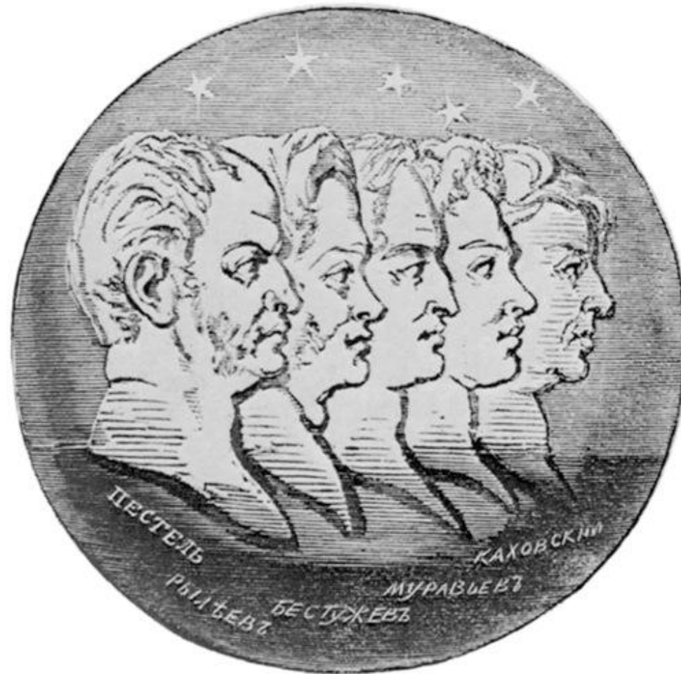
Силуэты пяти казнённых декабристов. Медальон с титульного листа альманаха «Полярная звезда»