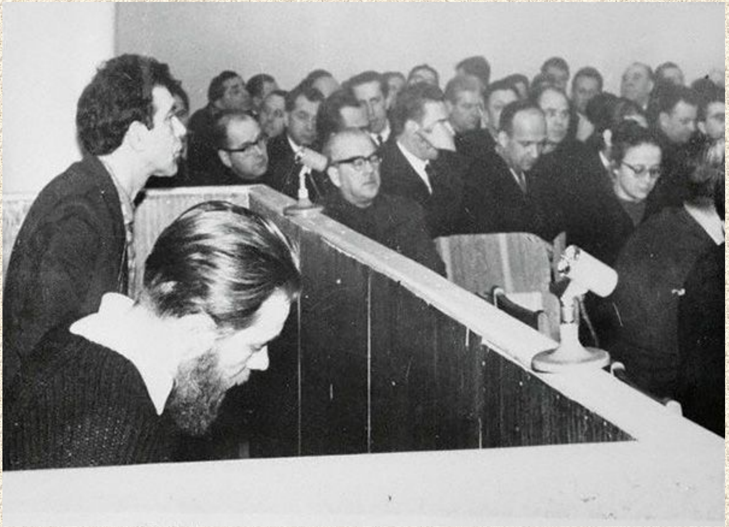
Судебный процесс против писателей А. Д. Синявского и Ю. М. Даниэля