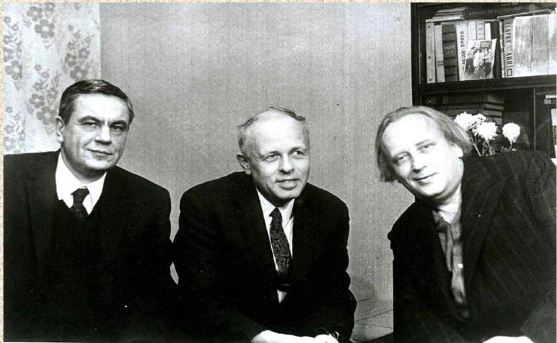
Комитет прав человека И.Г. Шафаревич (слева), А.Д.Сахаров, Г.С.Подъяпольский. Москва, 1973

1970 г., создание первой правозащитной организации - Комитета прав человека в СССР, в состав которого вошли Андрей Сахаров, Александр Солженицын, Александр Галич и др.