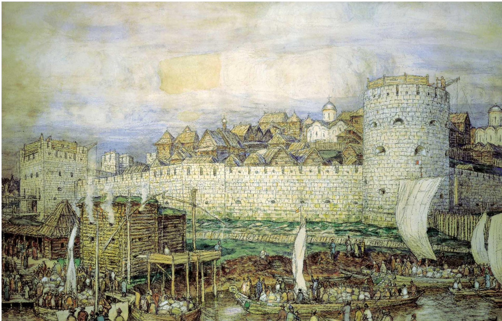
Белокаменный Кремль, возведен при Дмитрие Донском