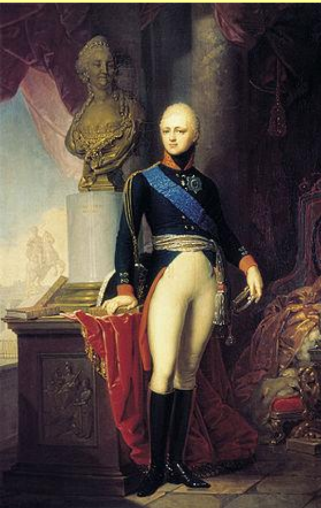
Император Александр I. 1802 г.