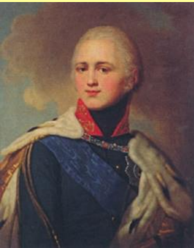
Император Александр I. 1802 г. Худ. В.Л. Боровиковский.

В Манифесте 12 марта царь обещал править «по законам и по сердцу в Бозе почивающей августейшей бабки нашей Екатерины Великия».