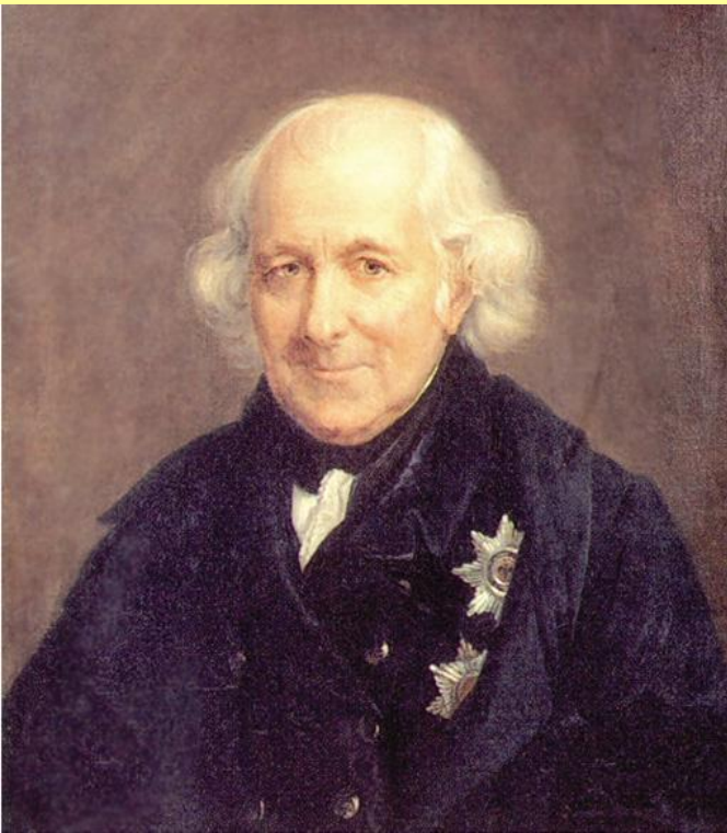
Адмирал Николай Семенович Мордвинов.

В 1801 г. по инициативе Н.С. Мордвинова принят указ о разрешении духовенству, купцам, мещанам, государственным крестьянам покупать «ненаселенные» земли. Дворянство формально лишилось монополии на владение землей. К крепостному праву это не имело отношения, хотя Мордвинов надеялся, что новые владельцы, не имея крепостных, станут использовать наемный труд, и дворяне, убедившись на их примере в невыгодности крепостного труда,