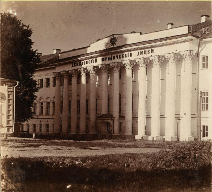
Демидовский лицей. г. Ярославль. 1910 г.

К университетам были приравнены привилегированные средние учебные заведения – лицеи. Первый лицей – Демидовский, основан в 1805 г. в Ярославле. 1809 г. – Ришельевский лицей в Одессе (назван в честь основателя Одессы, герцога А.-Э. Ришелье, царского наместника на юге, французского эмигранта). 1811 г. – Царскосельский лицей.