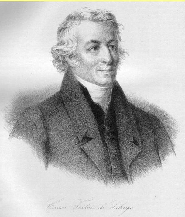
Фредерик Цезар Лагарп.

С августа 1801 г. до мая 1802 г. в России находился воспитатель Александра I Ф.-Ц. Лагарп.