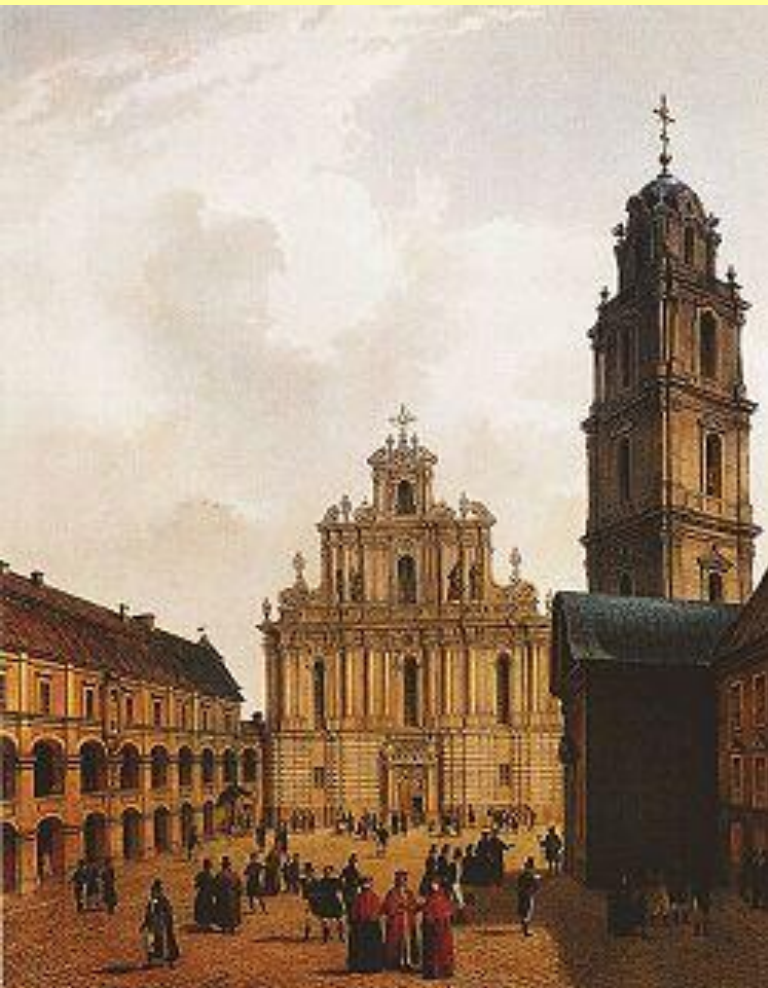
Большой университетский двор Виленского университета. Середина XIX века.

Созданы 4 университета: Дерпт (1802 г.), Вильно (1803 г.), Казано (1803 г.), Харьков (1805 г.) 1804 г. – в Петербурге открыт Педагогический институт (в 1819 г. преобразован в университет). Созданы 6 учебных округов. В университетах разрабатывали программы и учебные пособия, готовили учителей. Учебные округа возглавляли попечители – видные вельможи (Петербургский – Новосильцев, Виленский – Чарторыйский).