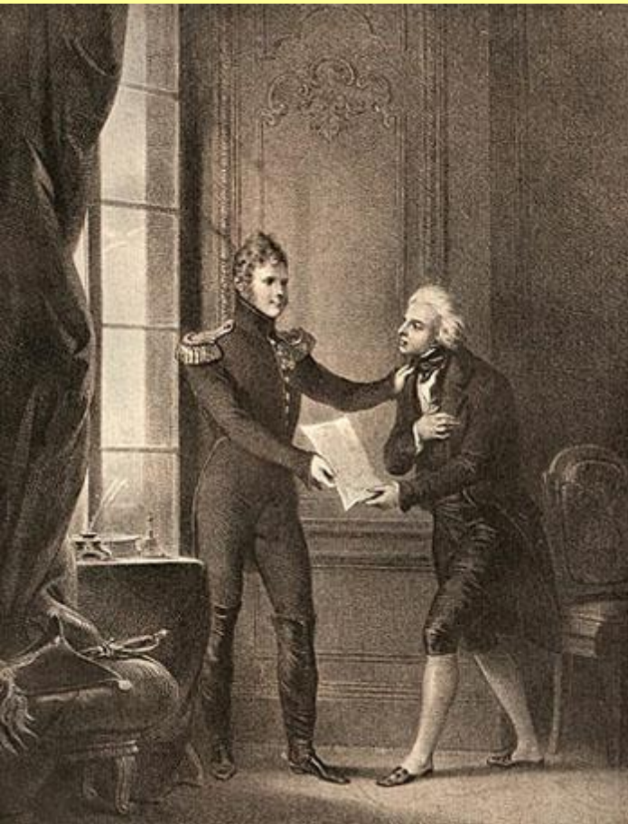
Граф С.П. Румянцев получает от Александра I указ об освобождении крестьян. Гравюра начала XIX в.

Февраль 1803 г. – указ о вольных хлебопашцах.