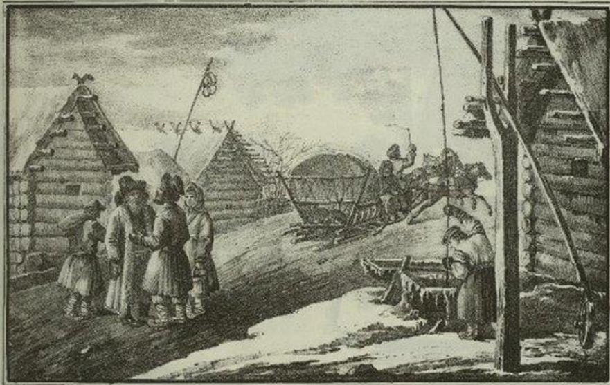
Жизнь русской деревни. Гравюра по оригиналу А.С. Орловского.