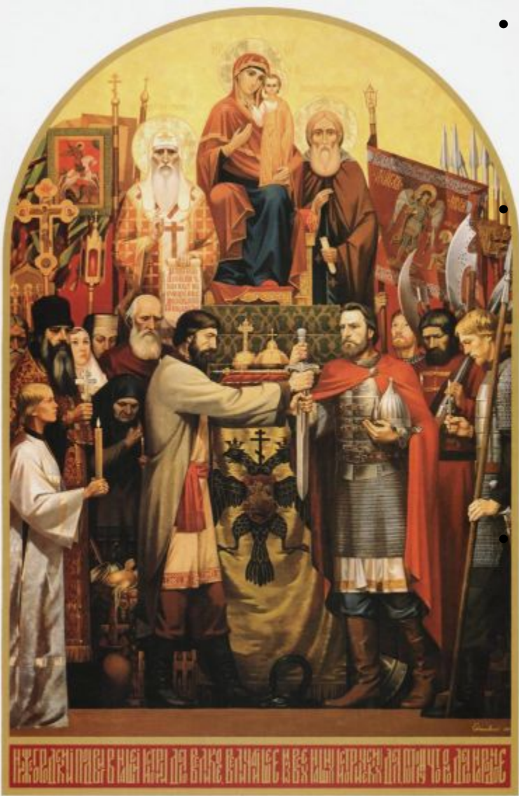
«НИЖНЕГОРОДСКИЙ ПОДВИГ. 1611 ГОД»