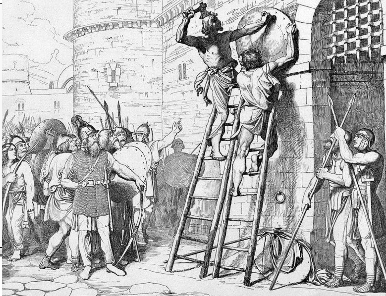
Олег прибывает щит свой к вратам Царьграда. Гравюра Ф. А. Бруни, 1839