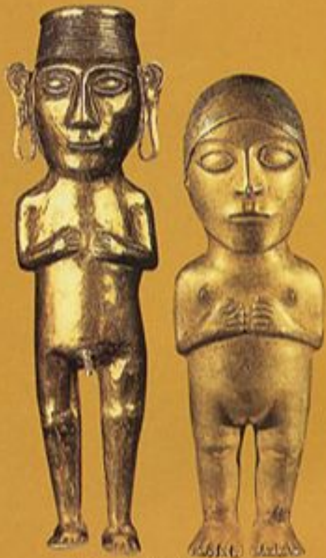
Pacha Tata-Pacha Mama