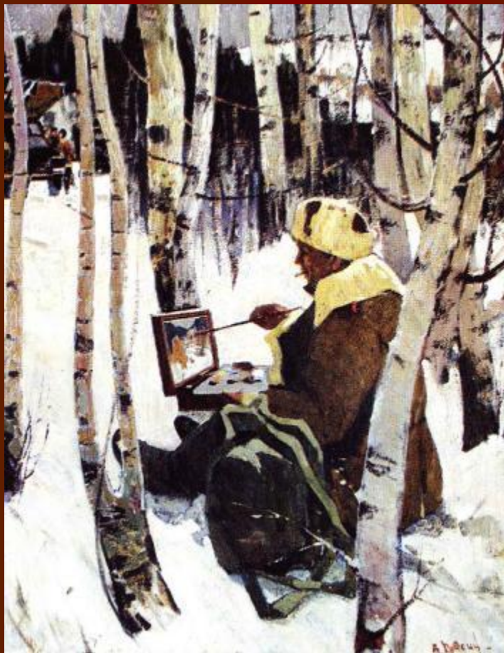
В.Крысин «Между боями»

Картины – это колокола, которые не позволяют забыть о том, что было.