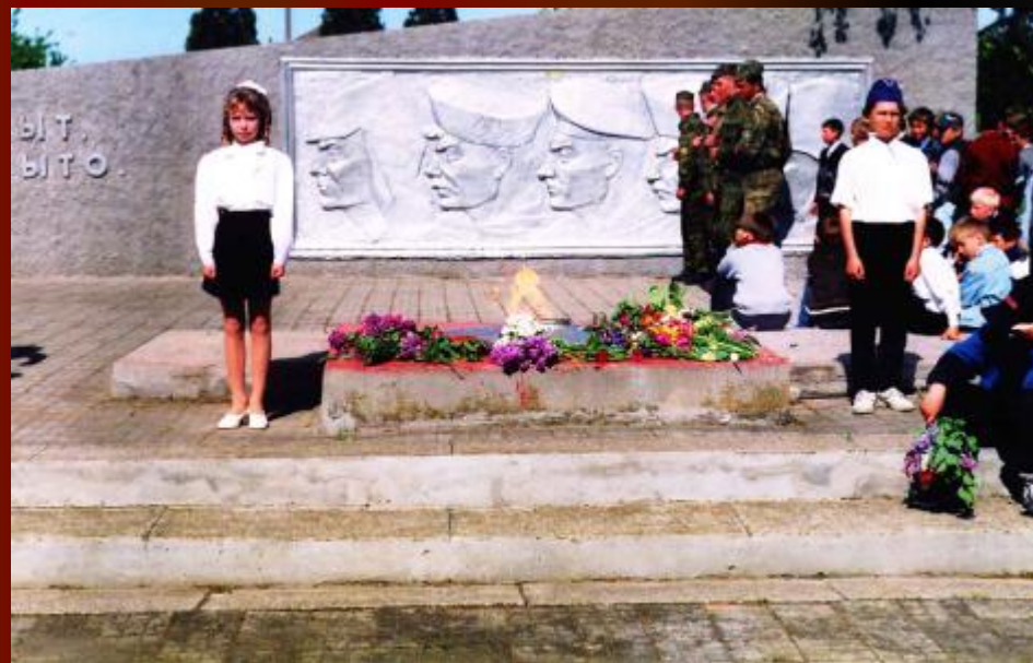
Вахта памяти у Вечного огня. ст.Должанская.

Пусть всегда на братских могилах будут живые цветы. Вечная память павшим в боях при защите Отечества – нашим сыновьям, отцам, дедам, братьям, сестрам, родным, друзьям. Пусть всегда на планете будет мир и спокойствие!