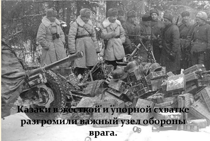
Казачи в жесткой и упорной схватке разгромили важный узел обороны врага.

Десятки тысяч советских воинов пали в этих боях. Танкисты 2-й армии, казаки корпуса В. В. Крюкова, сибиряки-лыжники, воины внутренних войск и пограничники 181-й дивизии 70-й армии, красноармейцы 194 дивизии и 115-й стрелковой бригады 65-й армии и многие другие отдали свои жизни, чтобы хоть на день, хоть на час приблизить Победу.