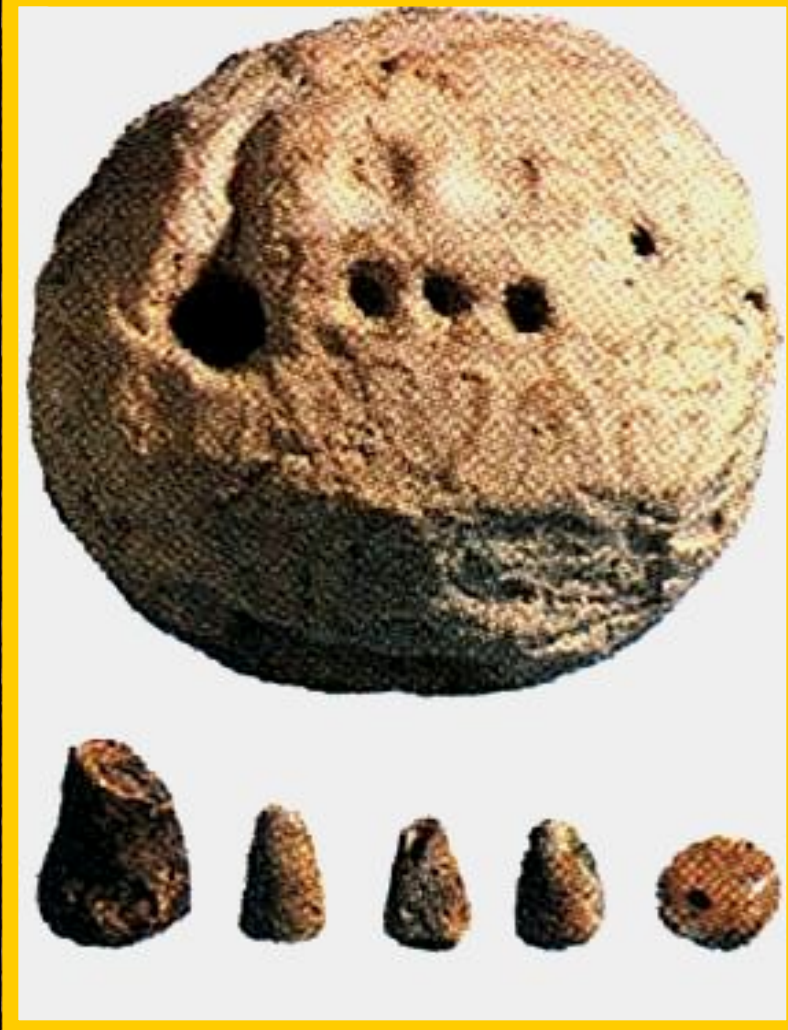
Табличка для счета.

Во главе школы стоял «отец». Ему помогали старшекласник-«старший брат» и «человек с палкой».